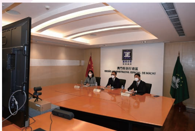
廉政公署參加國際反貪局聯合會視像會議

在國際事務方面，廉政公署持續與其他國家及地區保持良好溝通，積極履行作為國際或區域組織成員的義務，做好廉政建設工作。