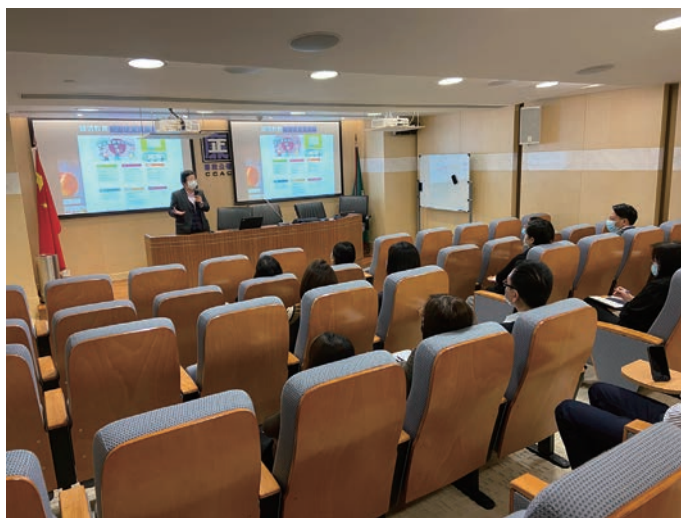
積極為公署人員開展內部培訓

廉政公署還積極開展內部培訓，當中包括關於公職人員專職性及不得兼任義務的培訓，使相關人員進一步明晰其界定及內容，以利於宣傳教育相關工作的開展；另外，亦邀請資深教育工作者提供培訓，討論及訂定不同教育階段教學計劃的編寫元素，助人員進一步提升誠信教育及宣傳的工作效益。