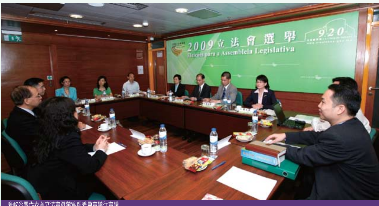
廉政公署代表與立法會選舉管理委員會舉行會議