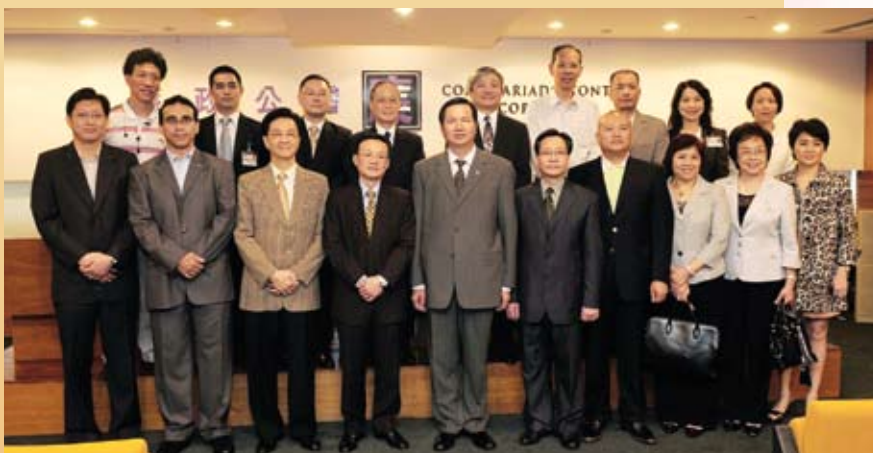
廉署領導與到訪議員合照留念

多位立法議員5月14日到訪廉政公署，與廉政專員張裕等座談，並參觀廉署設施。議員們均表示透過是次座談及參觀，有助加強對廉署的認識，對審議相關法律草案以至推動未來廉政工作建設均有實際作用。