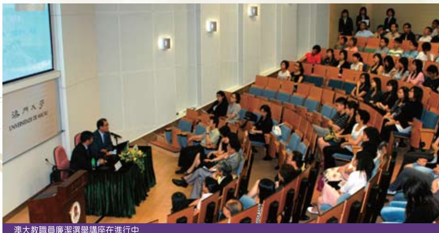
澳大教職員廉潔選舉講座在進行中