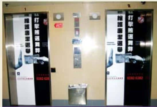
公共停車場電梯門廣告