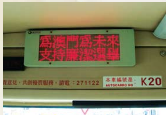
巴士車廂走字廣告