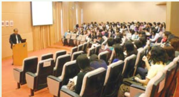
在鏡湖護校舉行講座

4月至7月份之內，廉政公署繼續進行廉潔選舉宣傳工作，期間內項目及活動有多類，現分述如下。