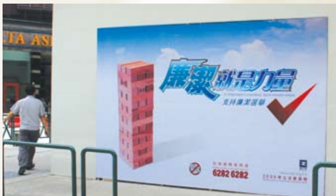
在政府資訊中心外的廣告