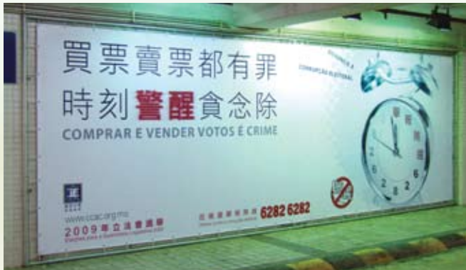
公共停車場大型廣告

廉署在政府資訊中心及市區多處裝設戶外廣告橫額或燈柱旗，並在公眾場所例如停車場增設廉潔選舉宣傳廣告，且在多個政府部門公眾接待區播放電視廣告，又陸續增加巴士廣告車輛數目，將廉潔選舉的宣傳帶到本澳不同角落。