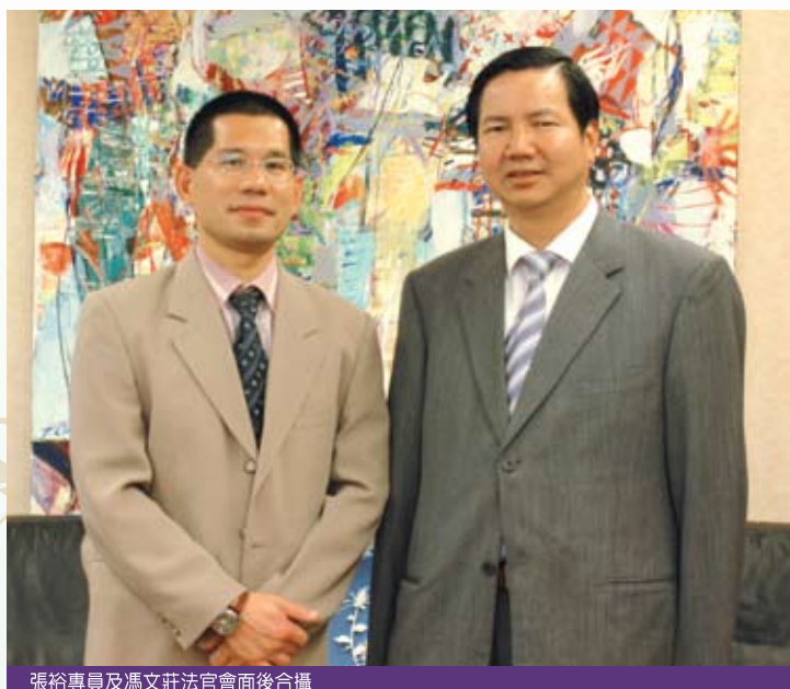
張裕專員及馮文莊法官會面後合攝

張裕專員及馮文莊法官就過去兩屆立法會選舉中所出現的問題、立法會選舉制度因應該等問題而作出的調整，以及如何確保2009年立法會選舉公正廉潔等事宜充份交換了意見，並希望在立法會選舉制度得到改善後，進一步加強廉署及立法會選舉管理委員會的溝通和合作，致力預防在2009年立法會選舉中出現舞弊違規行為，尤其透過發出清晰的指引和資訊，為創造公平的選舉競爭環境提供最佳的條件。