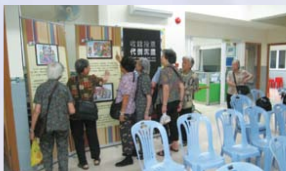
社區中心巡迴展覽