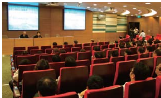
為中國銀行職員舉行講座 (2009-6)