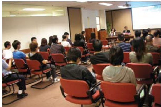
土地工務運輸局人員出席廉潔管理工作坊 (2009-5)