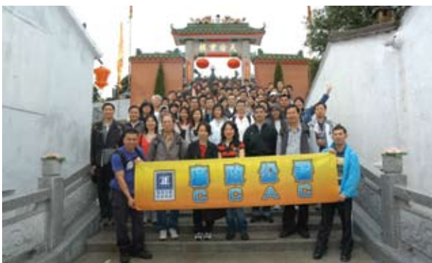
廉署人員往塔門郊遊 (2009-6)