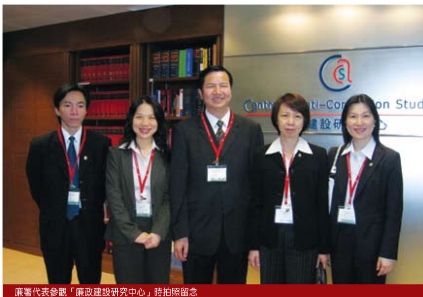
廉署代表參觀「廉政建設研究中心」時拍照留念

訪港期間，澳門廉署代表團一行先後到香港律政司和高等法院參觀，了解香港的法治、檢控政策、司法制度以及法庭的運作。