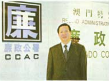
廉政專員張裕表示，廉政監察範圍擴展至私人領域，將可營造一個公平、公正的營商環境。

對於政策所涉及的私人領域，以及對個別行為的定義，各行各業和社會各界普遍關心某些行業的新管轄特色，「行賄」、「受賄」(包括「回扣」、「收賄」)等行為是否屬此有關法條？怎樣的行為才構成行賄、受賄？這些問題都是值得探討的。