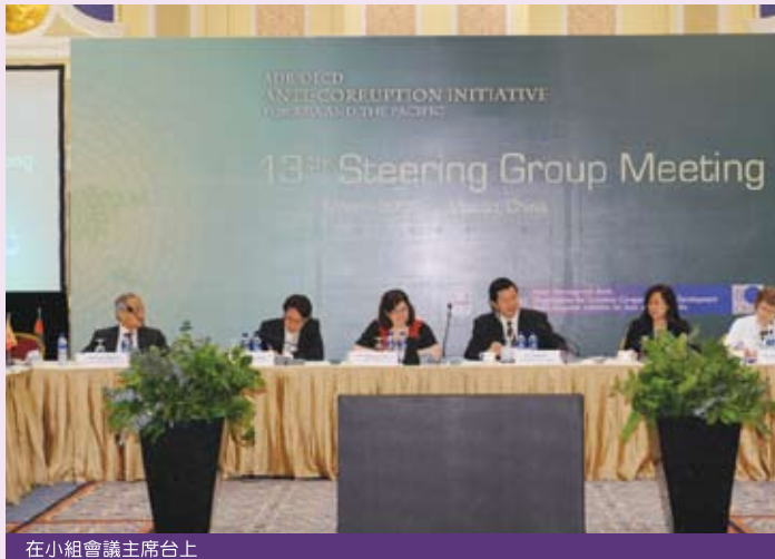
在小組會議主席台上

是次會議共分兩部分進行。首兩日先進行「亞太地區反腐敗行動組第13次指導小組會議」，其後兩天則舉行以「預防腐敗的良好做法」為題的「第8次區域會議」。參與是次指導小組會議的國家/地區有28國家，代表70名，多個