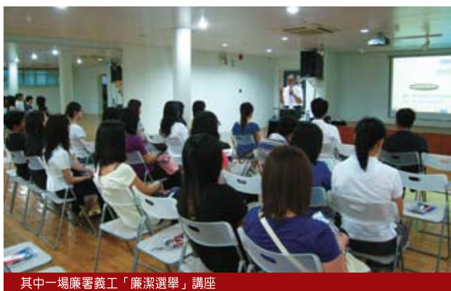
其中一場廉署義工「廉潔選舉」講座

廉政公署為增強「廉潔義工隊」的實力，今年4、5月間再次招募義工隊新成員，經甄選後有逾300人加入。注入了新力量的「廉潔義工隊」，現有成員增至500多人，來自社會不同階層和行業，包括：醫生、護士、工程師、教師、退休人士、家庭主婦、公職人員、大學生、中學生等等。