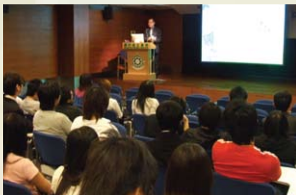
理工學院學生細心聆聽講座

8月至9月期間，廉政公署將舉行3場大型戶外綜藝表演活動『廉潔選舉響全城』，藉此廣泛宣傳廉潔選舉意識，同場亦設有展覽及攤位遊戲，有關日期及地點如下：