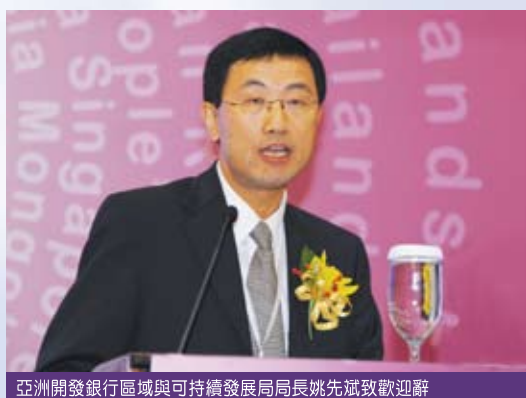
亞洲開發銀行區域與可持續發展局局長姚先斌致歡迎辭