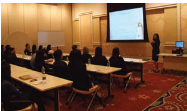
為永利酒店員工舉行廉潔講座 (2009-5)