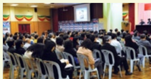
應社團邀請舉行廉潔選舉講座