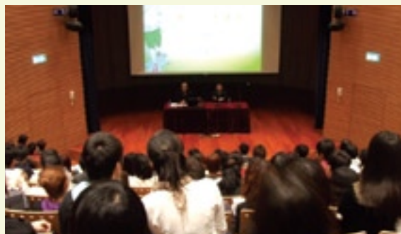
為澳門大學法學院學生舉行廉潔選舉講座