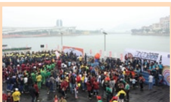
市民在「支持廉潔選舉留言板」上簽名