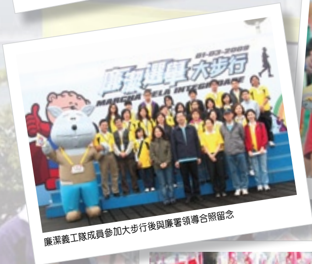
廉潔義工隊成員參加大步行後與廉署領導合照留念