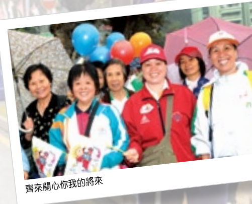
齊來關心你我的將來