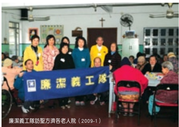
廉潔義工隊訪聖方濟各老人院（2009-1）