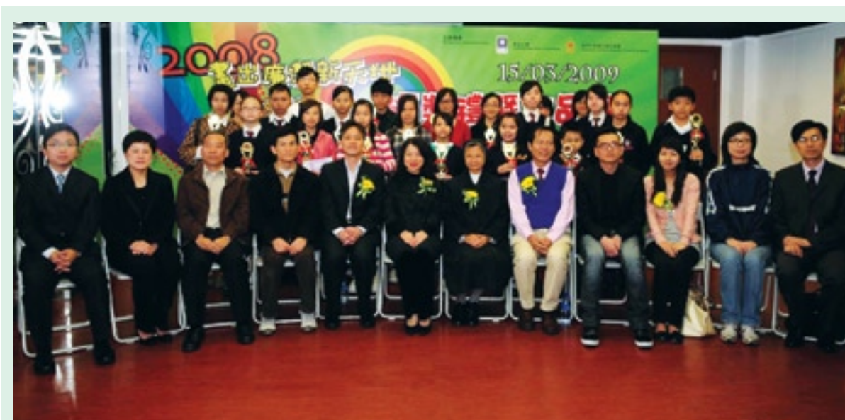
嘉賓與得獎者的大合照

為了讓青少年了解建立個人誠信和建設廉潔社會的重要性，廉署希望通過這項比賽，能夠發揮青年人的繪畫及創作天份，令參賽者在設計漫畫的過程中有所體會，藉此培養出廉潔意識，建立正確的道德價值觀。