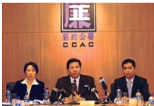
廉政專員張裕、助理專員杜慧芳及顧問胡家偉出席並主持記者會

廉政專員張裕在2月中的記者會上公布了廉署2008年反貪及行政申訴範疇的收案數字，2008年收案796宗，同比去年上升8.2%。張裕表示，具名投訴比以往有所上升，達47%，親身舉報有19.1%，為歷年最高。2008年經法院審判的案件有9宗，全部均有被告被判罪名成立及被判刑，當中3宗與歐案有關。