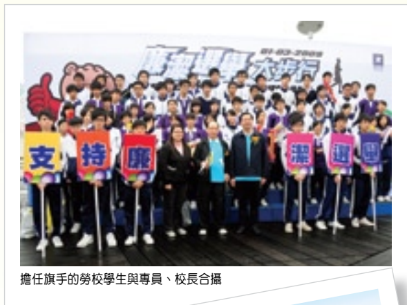
擔任旗手的勞校學生與專員、校長合攝