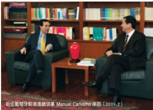
新任葡萄牙駐港總領事 Manuel Carvalho 來訪（2009-2）