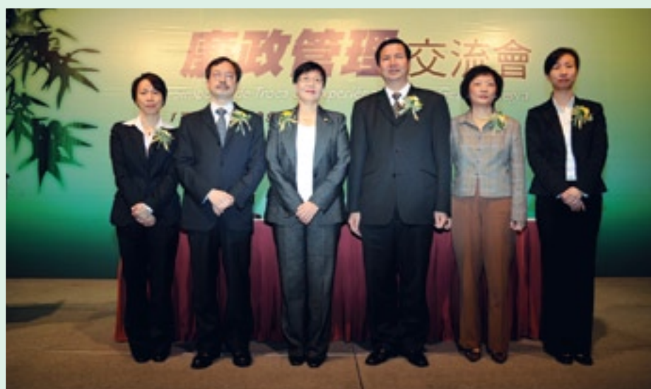
(右起)黃竹君院長、歐陽呂妙群處長、廉政專員張裕、戴婉瑩申訴專員、黎英杰局長及杜慧芳助理專員合攝於交流會開幕儀式上

為進一步促進特區政府的廉潔管理機制的完善，廉政公署於2月17日下午假澳門旅遊塔四樓舉行「廉政管理交流會」，約250位政府部門中高層管理人員出席，包括行政長官辦公室及各主要官員辦公室顧問、各公共部門及機構的領導及主管等，共同就「廉潔管理計劃」的執行情況進行總結及經驗分享。