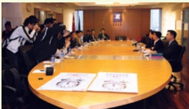
廉署與傳媒團體舉行座談

廉政公署應不同社團的邀請，於2月至3月期間舉辦了多場廉潔選舉講座。在講座中，廉署人員重點講解了新修訂的選舉法規中有關賄選行為的規定，並即場解答市民的問題。