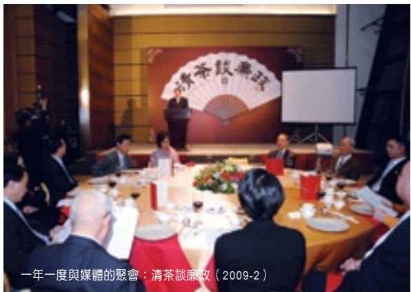
一年一度與媒體的聚會：清茶談廉政（2009-2）