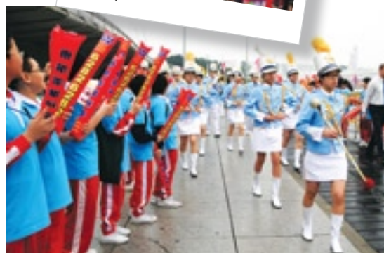
聖德蘭小學學生歡迎濠江銀樂團抵埗