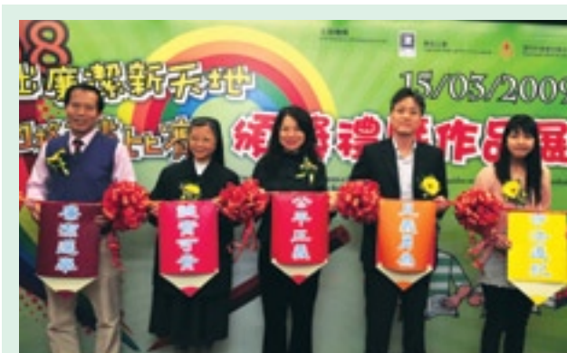
嘉賓主持開幕儀式