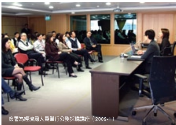
廉署為經濟局人員舉行公務採購講座（2009-1）