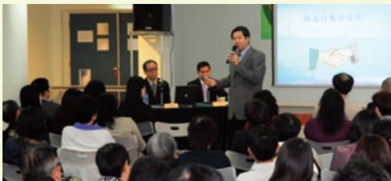
廉政專員張裕出席北區座談會

廉政公署在北區、中區及離島區先後舉行3場座談會，廣泛邀請社團代表及市民出席，藉此了解他們對廉潔選舉的意見和建議，並爭取市民的支持。