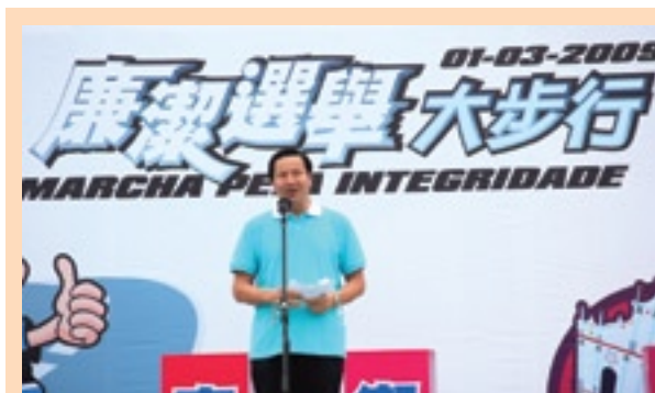
廉政專員張裕在起步儀式上致辭

大隊在濠江步操旗樂隊和勞校學生組成的彩旗隊引領下，為支持廉潔選舉齊舉步，從西灣湖廣場出發，繞行西灣湖後至終點站西灣湖畔水上活動中心廣場，全程約2.5公里。各嘉賓和市民到達後，紛紛在終點站設置的「支持廉潔選舉留言板」上簽名，表達他們對廉潔選舉的期望，並拍照留念。