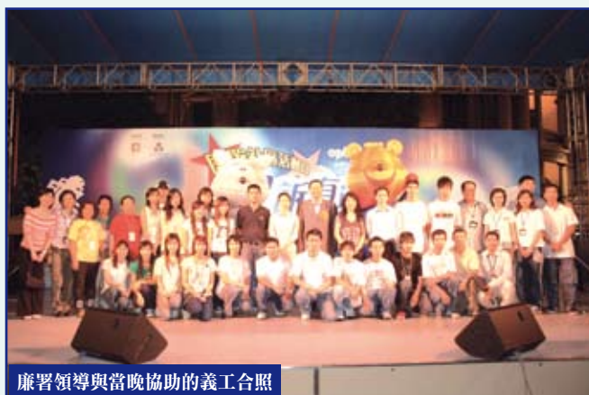
廉署領導與當晚協助的義工合照