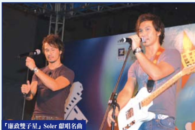
「廉政雙子星」Soler 獻唱名曲