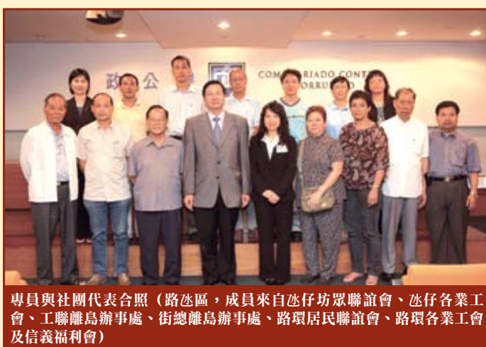
專員與社團代表合照（路氹區，成員來自氹仔坊眾聯誼會、氹仔各業工會、工聯離島辦事處、街總離島辦事處、路環居民聯誼會、路環各業工會及信義福利會）