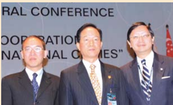
助理廉政專員陳錫豪代表參加「第三次中國－東盟成員國總檢察長會議」，會上與中國最高人民檢察院檢察長賈春旺(中)及香港廉政專員黃鴻超(右)合照 (07/2006)