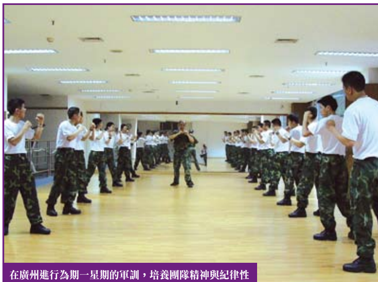
在廣州進行為期一星期的軍訓，培養團隊精神與紀律性

在這16個星期的課程中，我不時會感到壓力的存在。印象最深刻的是案件實習，在模擬的案件調查中可以運用到所學過的調查技巧，雖然犯了不少錯誤，但從中吸取了經驗教訓，對日後的工作將有很大的幫助。記得有一次作模擬調查，由於在首階段對調查內容的觀察欠精細，不慎走錯了一小步，不料這個細微的閃失卻「影響深遠」，導致在整項實習中遭到挫敗。這次失敗的經驗使我體會到，在任何調查中必須仔細地作觀察、搜證、分析、審定和判斷，差之毫釐，便會謬以千里。