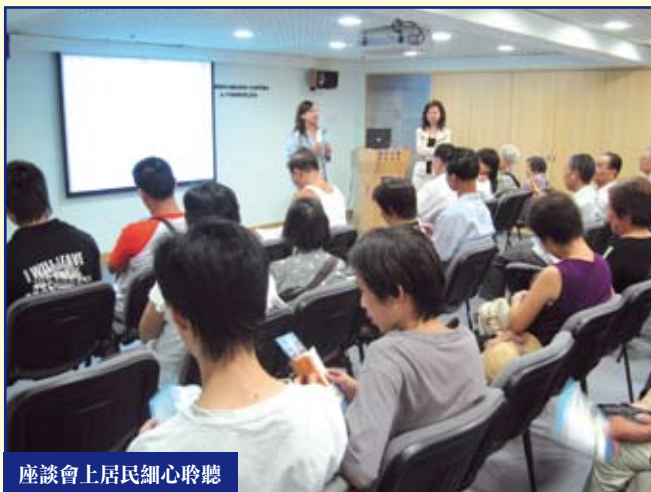
座談會上居民細心聆聽

為加強市民對行政申訴職能的認識，維護合法權益，廉政公署在本年6月份開始，邀請多個社團參與「維護權益 申訴有道」座談會，期望市民透過該活動認識到維護個人合法權益、建設廉潔社會的重要性。