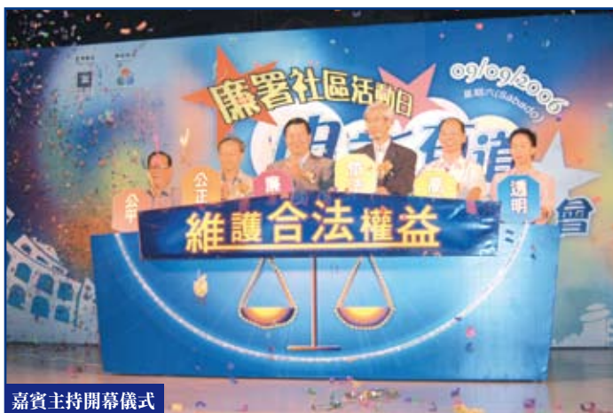
嘉賓主持開幕儀式

當晚有近三十位廉潔義工隊成員到場，協助接待及派發宣傳品等工作，使晚會得以順利進行。