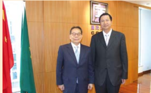
澳門基金會吳榮格主席來訪，與專員合攝 (08/2006)