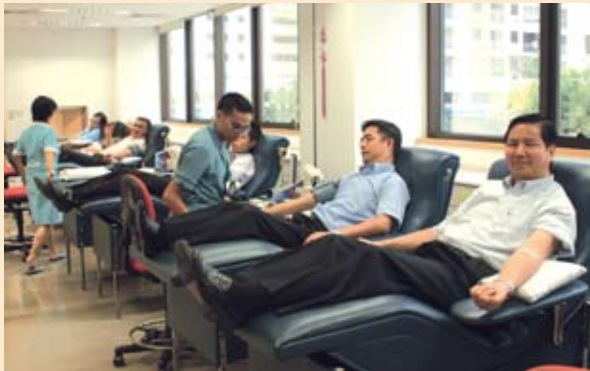
廉政專員率廉署同事捐血 (07/2006)