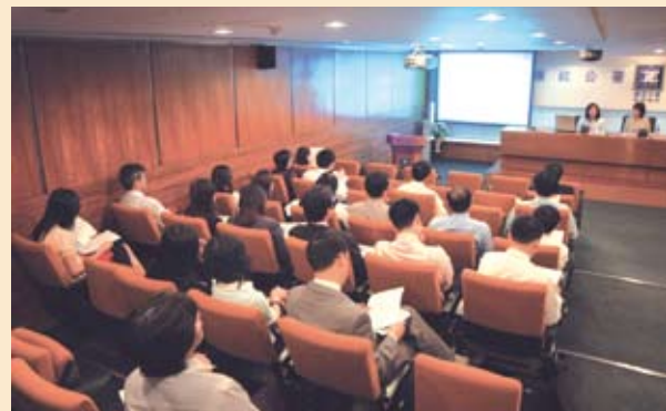
為中國工商銀行澳門分行職員舉辦「廉潔意識」講座 (07/2006)