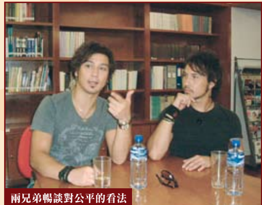
兩兄弟暢談對公平的看法

堅守原則的Soler在捍衛自己的立場時，有時亦會作出一些犧牲。他們說：「例如在剛才的例子中，那個監製在整個錄音過程中都板着臉。」Soler還說，有時朋友間有不同的立場及價值觀，堅持自己可能會損害彼此的友誼，不過當兩者不能作出平衡時，只能選擇一個自己認為正確的決定。