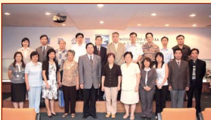
專員與社團代表合照（澳門區，成員來自街總、工聯、婦聯、中總、學聯、文員會、市販互助會、中華教育會及歸僑總會）