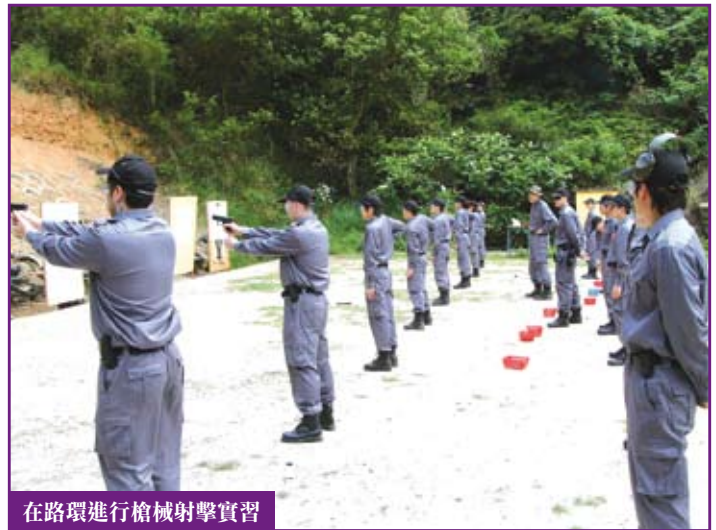
在路環進行槍械射擊實習

回想當初，我只是一個什麼都不懂的「黃毛小子」，抱着的只是一腔熱誠，便報名投考了「調查員」這個職位。獲知被錄取為培訓班學員的那一刻，心情既緊張又複雜：一方面擔心自己能否順利通過嚴格的考核，另一方面又為有機會成為廉署調查員，為澳門的廉政建設出力而興奮。