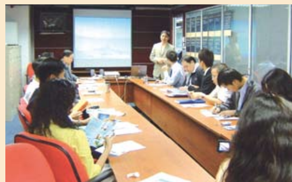
奧的斯電梯工程公司員工參加「廉潔意識」講座 (09/2006)