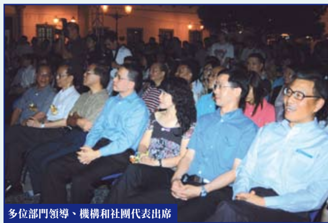
多位部門領導、機構和社團代表出席