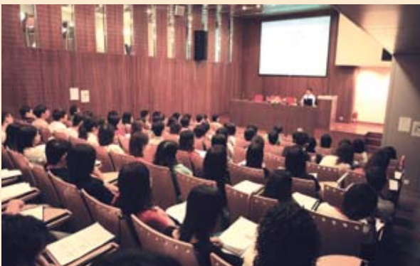
為司法文員學員舉辦有關「職務犯罪」講座 (08/2006)