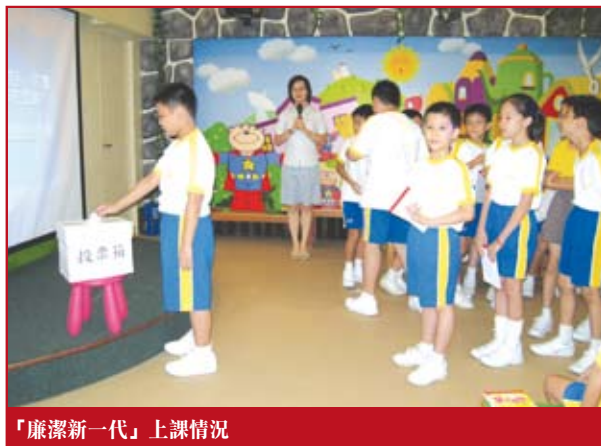
「廉潔新一代」上課情況

為方便各校報名參加本計劃，廉署已於6月份將計劃的簡介單張及報名表格送到各小學。凡對本計劃有興趣的學校，歡迎致電 2845 4424 與廉署社區辦事處聯繫。