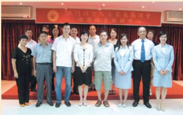
廉署代表訪問弱智人士家長協會 (08/2006)