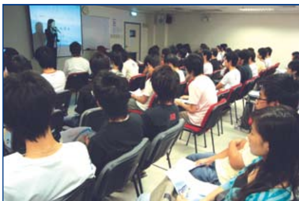
為統計暨普查局臨時工作人員舉辦講座

統計暨普查局於今年8月進行“2006中期人口統計”，並為此招聘了一批臨時工作人員協助相關工作。由於該批工作人員在任職期間具有公務員身份，因此，廉署特別為他們舉辦「廉潔意識」講座。講座分20場進行，人數約1,000人。廉署代表向他們簡介了廉署的職能、在執行公務期間須注意的事項，以及相關的法律規定和具體事例等，藉此提高他們的廉潔守法意識。