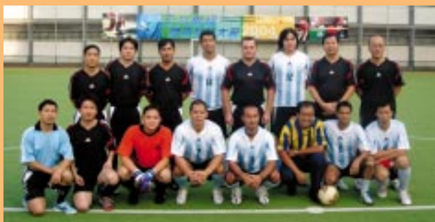
廉署足球隊參加「公共機構競技大會」，與初級法院隊對賽前攝。(10/2004)