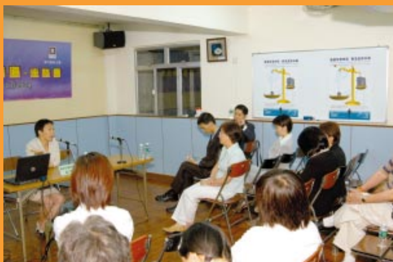
與街總合辦座談會 (07/2004)