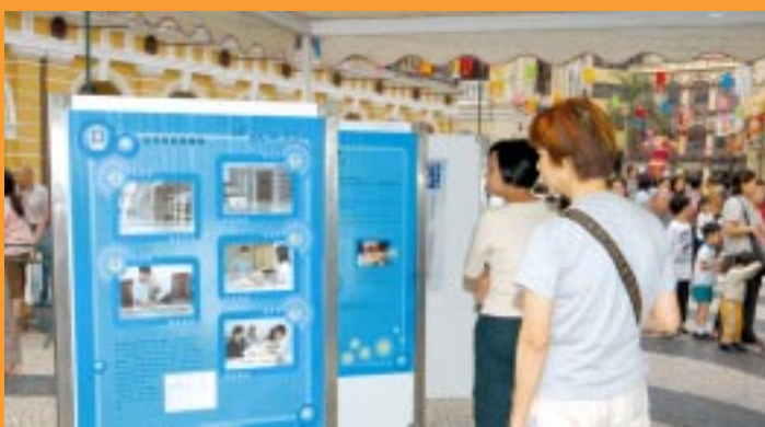
市民在細心閱覽展覽板