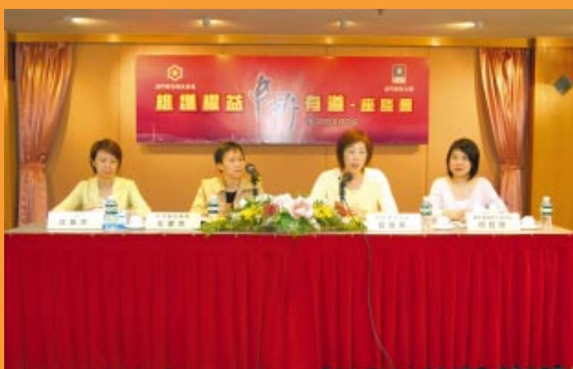
廉政公署與婦聯合辦「維護權益 申訴有道」座談會 (07/2004)