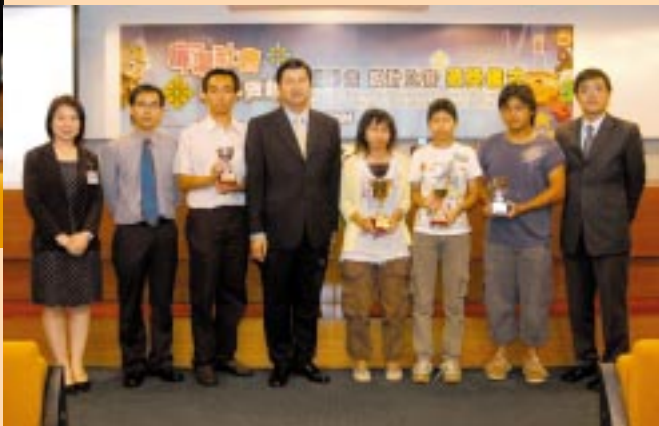
廉署與學聯合辦的『廉潔社會，由我做起』電腦動畫設計比賽頒獎儀式。(08/2004)