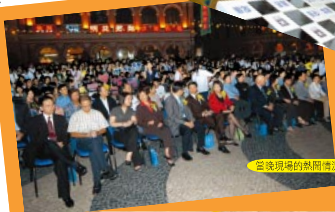
當晚現場的熱鬧情況