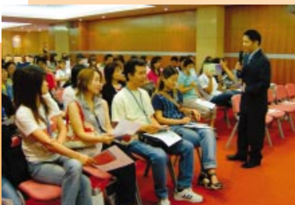
為澳門旅遊博彩技術培訓中心學員舉行「廉潔守法」講座。(07/2004)