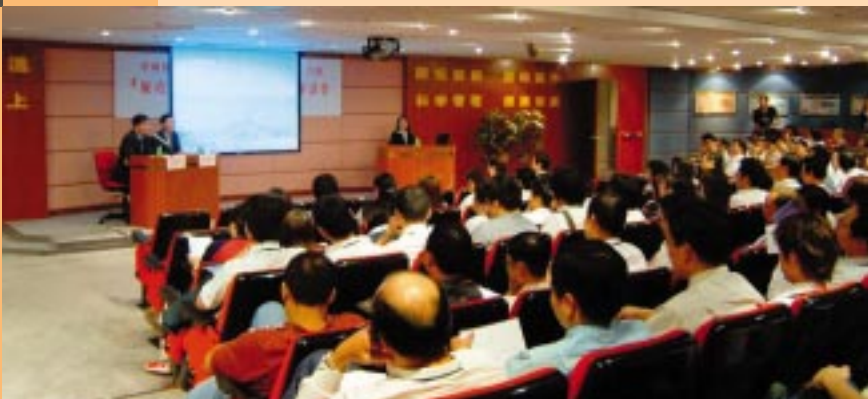
為中國銀行澳門分行職員舉行2場「廉潔守法，職業道德操守」座談會。(08/2004)