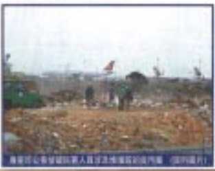
海濱花園第二期填海區，區議員及地產商在填海區。(資料圖片)