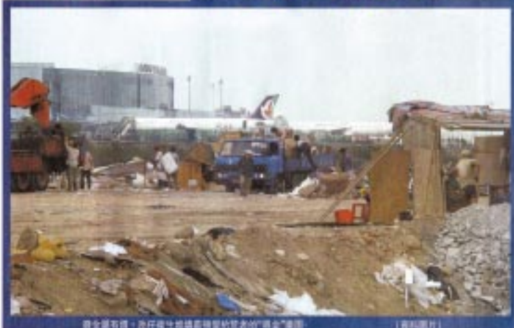
廢鐵堆填區，渣仔與垃圾堆積成山，是商人的“現金”來源。(資料圖片)

據兩名商人向海濱花園區議員，每禮拜向區議員支付數千元，以作區議員的酬勞。區議員將收來的數千元，一部分交給區議員，另一部分則請區議員吃飯。