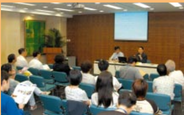
為匯業銀行領導層及員工舉行4場「廉潔守法」講座。(08/2004)