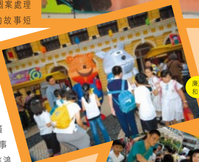
廉潔樂園兩卡通人物「威廉」和「大牙」亦到場助慶