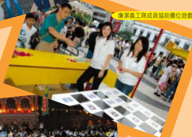
廉潔義工隊成員協助攤位遊戲