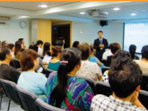
台山坊會理監事到廉署社區辦事處參與座談會 (08/2004)