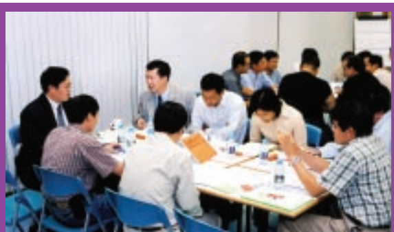
為部門領導和主管舉辦工作坊