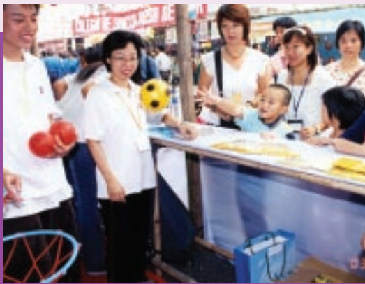
在第34屆明愛慈善園遊會中，廉政公署的遊戲「投訴有門」廣受歡迎。(11/2003)