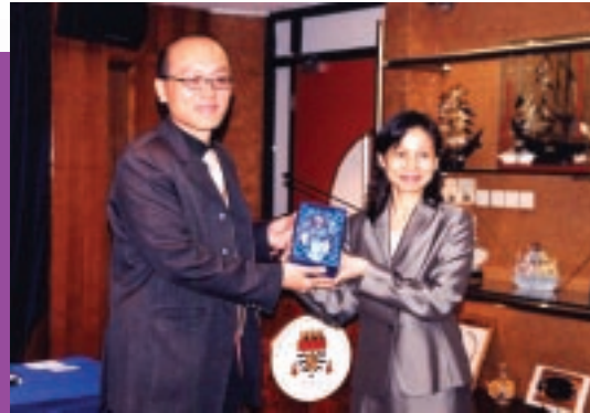
為澳門大學職員作「公務採購制度」講座後，校方向公署致送紀念品。(11/2003)