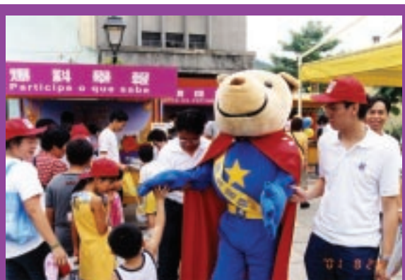
部署2005年立法會選舉防賄選工作

展望2004年，廉政公署將致力防範貪污的高危領域，就2005年第三屆立法會選舉做好部署，繼續清除公職中的積習，並大力發展社區關係，深化廉政建設工作，爭取促進澳門達至國際廉潔城市的水平。