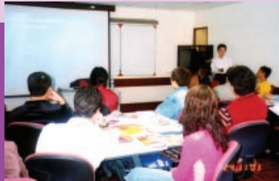
公務人員基本培訓課程「廉潔奉公」簡語單元首次開課。(11/2003)