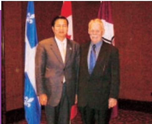
廉政專員張裕出席國際申訴專員協會理事會會議，並與理事會主席Mr. Clare Lewis合照。(10/2003)