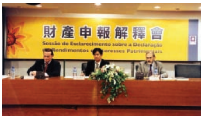
財產申報葡語講座