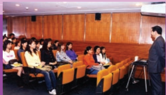
廉政專員在「廉潔意識」講座中勉勵澳大教育學院應屆畢業生。(11/2003)