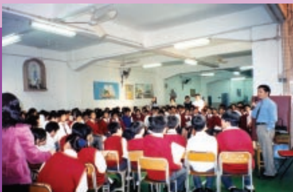
廉署「青少年誠信教育計劃」正式開展。(11/2003)