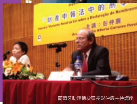
葡萄牙助理總檢察長彭仲廉主持講座