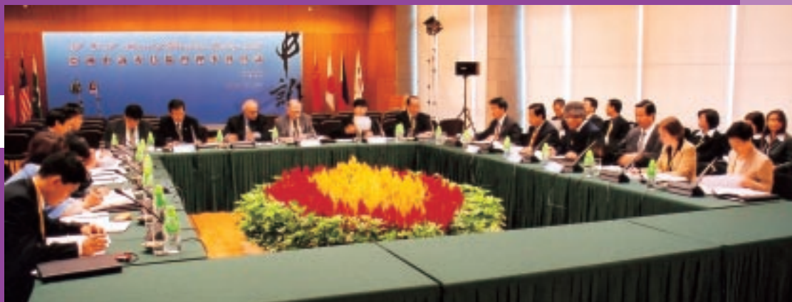
在澳門文化中心會議廳舉行會議