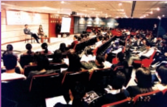
廉政專員為新青協主辦之「真情對話」活動作主講嘉賓，與百多位青年分享其工作經驗。(11/2003)