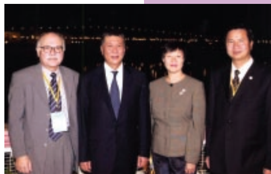
行政長官與A.O.A.理事會主席、香港申訴專員及澳門廉政專員合照