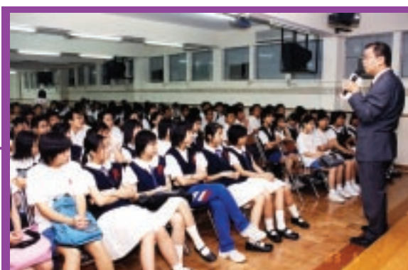
為青少年進行廉潔教育