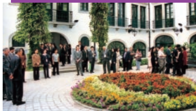
參觀訪問民政總署

透過這短短兩天的會議行程，各與會者除了加強相互間的溝通和聯繫外，也進一步了解澳門政府的行政運作。