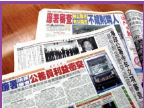
對現行法律制度作制度審查