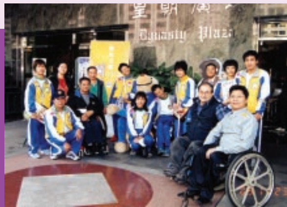
廉署開放日吸引眾多市民參觀。(11/2003)