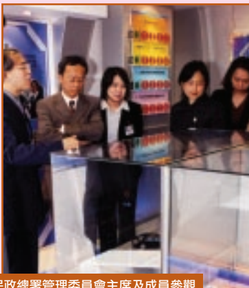
民政總署管理委員會主席及成員參觀廉署展覽室 04-03