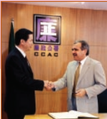
葡萄牙駐澳總領事歐廷會到訪廉署 03-03