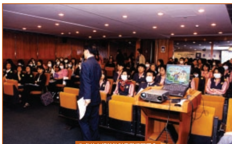
為各校老師就教科書舉行闡釋會

直至六月中，廉署寄送教材的學校中有接近九成表示會採用；其中二十間學校已率先在2002/03學年下學期使用，其餘四十間計劃在今年七月夏令班或2003/04學年使用。