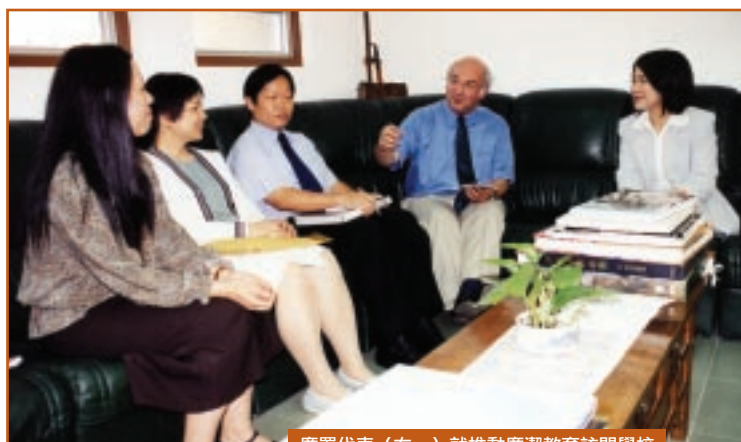
廉署代表（右一）就推動廉潔教育訪問學校

至於對廉署工作的意見，大部份學校認為廉政工作在回歸後有很大進步，有學校特別讚揚2001年廉署反賄選的成效，亦有部分學校表示廉署仍給人一種神秘的感覺，有需要繼續加強宣傳教育的力度。廉署會把各校提出的意見歸納整理，進行分析研究。