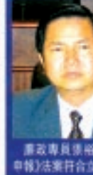
廉潔專員條例草案(財產申報)法案符合立法原意

關於修改現行《廉潔專員條例》的立法會一般性通過。代表政府提出的廉潔專員條例草案，法案主要係向廉潔專員對廉潔中樞制訂操作程序。以來的拉抬性問題，則化水地，非概念性，填塞漏洞。現階段政府需要對廉潔專員的對廉潔專員資料。