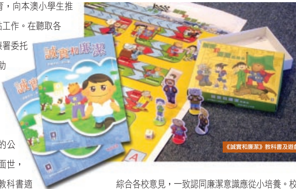
《誠實和廉潔》教科書及遊戲棋

在展開推廣方面，廉政公署先把《誠實和廉潔》教材、遊戲棋及新製作的廉政公署光碟送給全澳的小學，隨即從二月底起，廉署代表展開訪校活動，兩個月內共訪問了近五十間學校，與各校負責人就教科書、遊戲棋及廉政公署光碟的內容和使用方式進行討論，並藉此機會聽取各校對廉政工作的意見。