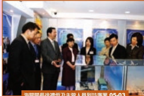
海關關長徐禮恆及主管人員到訪廉署 05-03