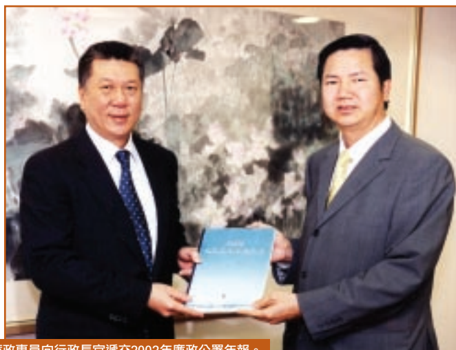
廉政專員向行政長官遞交2002年廉政公署年報。