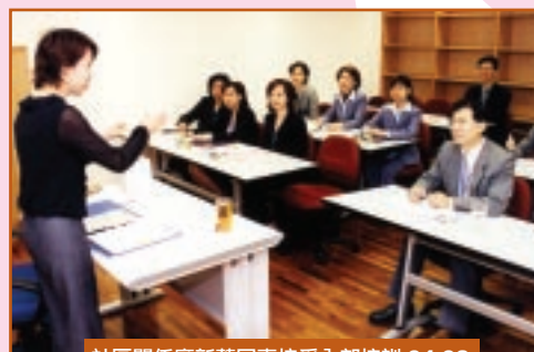
社區關係廳新舊同事接受內部培訓 04-03