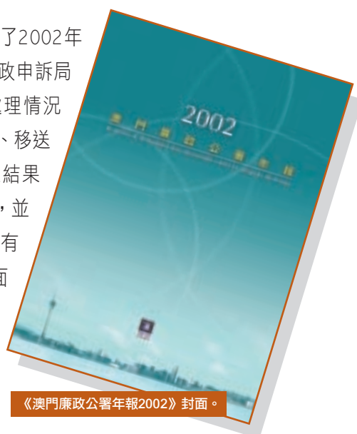
《澳門廉政公署年報2002》封面。