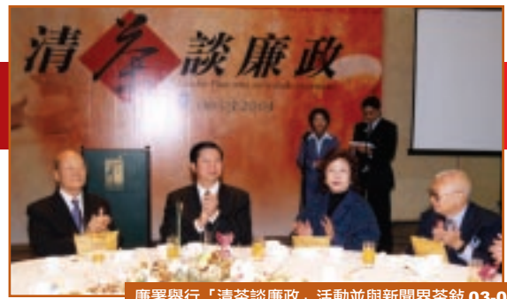
廉署舉行「清茶談廉政」活動並與新聞界茶敘 03-03