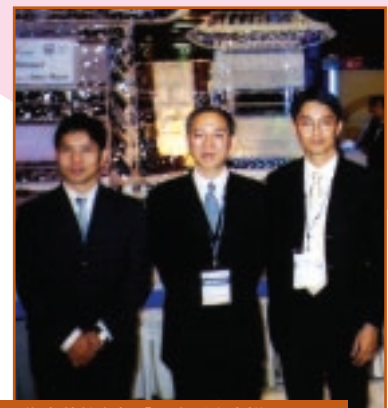
廉署代表赴韓參加「國際反貪會議」 05-03