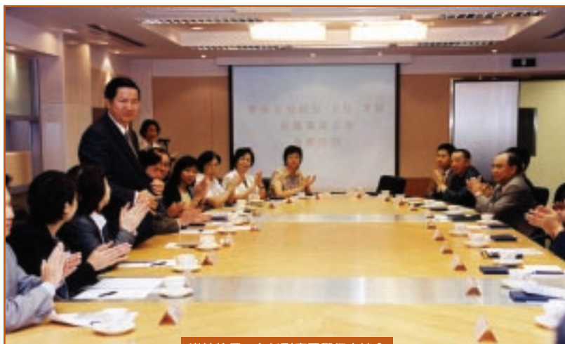
邀請校長、主任到廉署舉行座談會

在訪校的過程中，不少學校提出要求，希望廉署能為校內的中學生，尤其為將踏入社會工作或升讀大學的準畢業生舉辦講座，以鞏固廉潔正直的觀念。也有學校提議以動態的方式，如話劇、表演等，把廉署偵