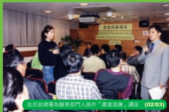
赴民政總署為驗車部門人員作「肅貪倡廉」講座 (02/03)