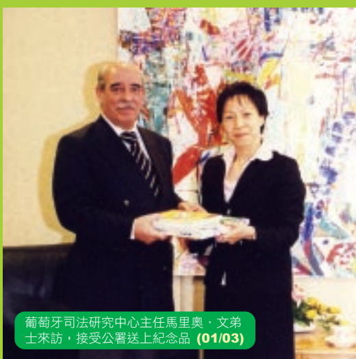
葡萄牙司法研究中心主任馬里奧·文弟士來訪，接受公署送上紀念品 (01/03)