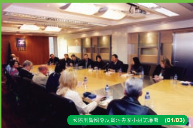
國際刑警國際反貪污專家小組訪廉署 (01/03)