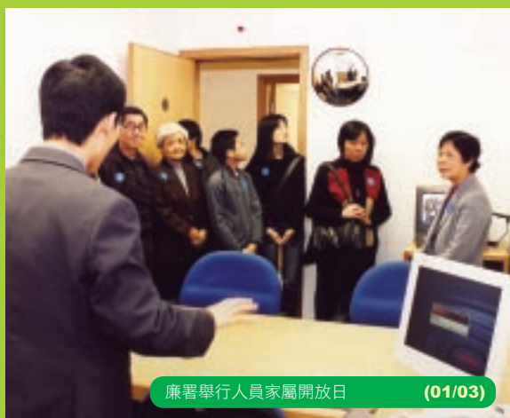
廉署舉行人員家屬開放日 (01/03)