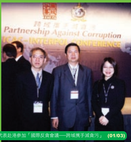
廉署代表赴港參加「國際反貪會議——跨域攜手減貪污」 (01/03)