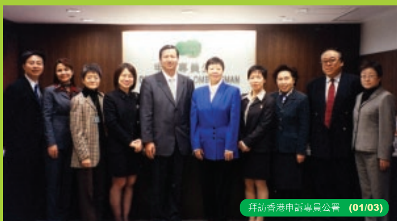
拜訪香港申訴專員公署 (01/03)