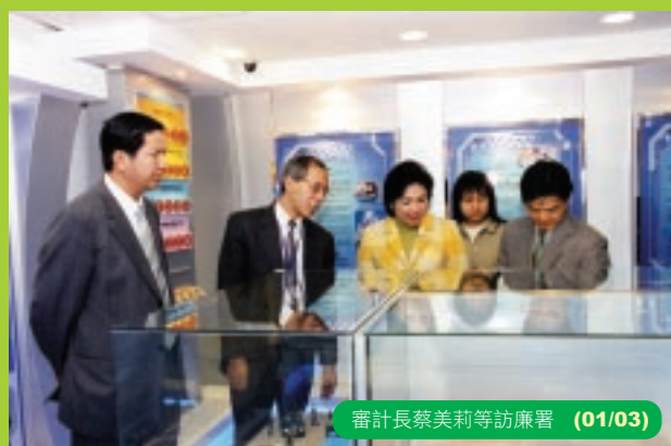
審計長蔡美莉等訪廉署 (01/03)