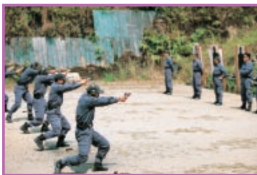
接受嚴格訓練，提升水平

展望二零零三年，廉署將繼續提升調查實力，加強與政府部門合作，致力預防貪污舞弊，推動公務員隊伍的道德建設，並擴大宣傳教育，多方面發展社區關係，務求整體配合，提高廉政建設的成效。