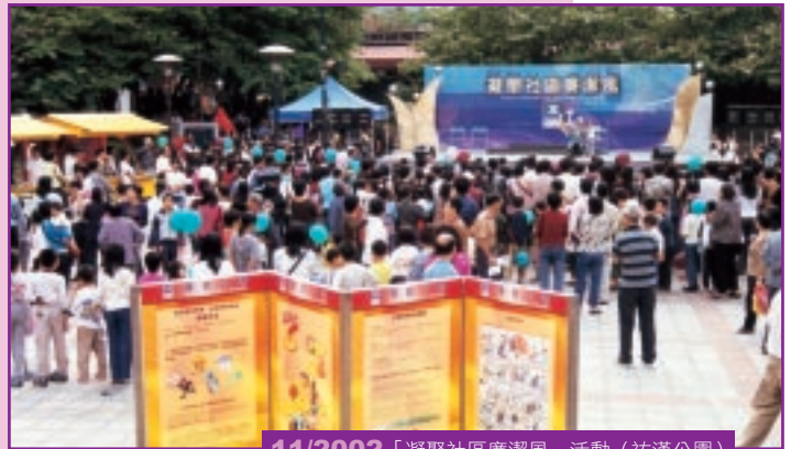
11/2002 「凝聚社區廉潔風」活動（祐漢公園）