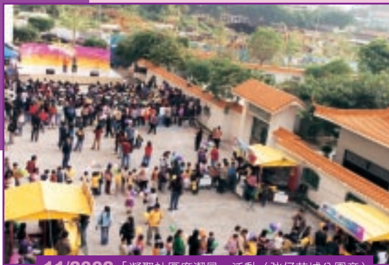
11/2002 「凝聚社區廉潔風」活動（氹仔花城公園旁）