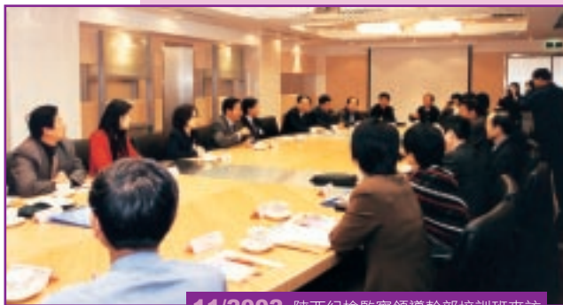
11/2002 陝西紀檢監察領導幹部培訓班來訪