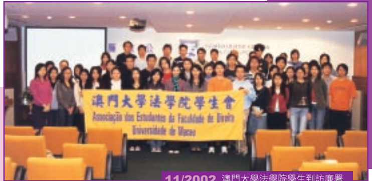
11/2002 澳門大學法學院學生到訪廉署