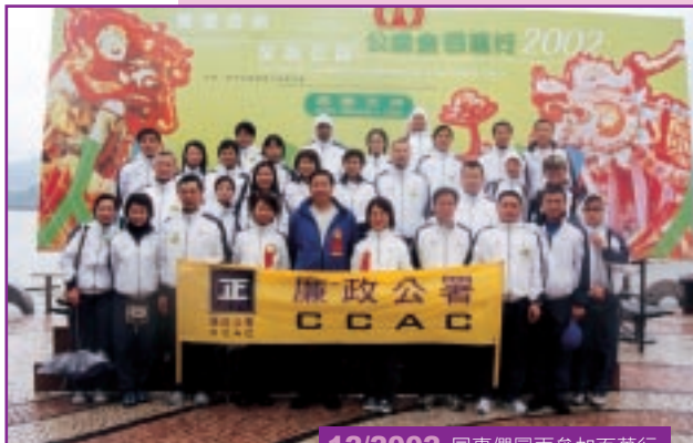
12/2002 同事們冒雨參加百萬行