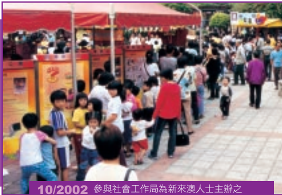
10/2002 參與社會工作局為新來澳人士主辦之「全意樂助新居民，共建美好新社群」活動