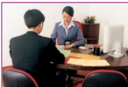
接待公務員遞交收益及財產利益聲明書