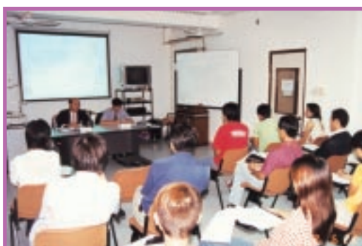
為公共部門作專題講座