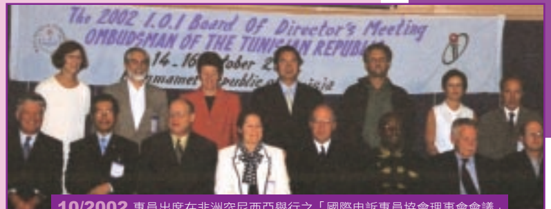
10/2002 專員出席在非洲突尼西亞舉行之「國際申訴專員協會理事會會議」