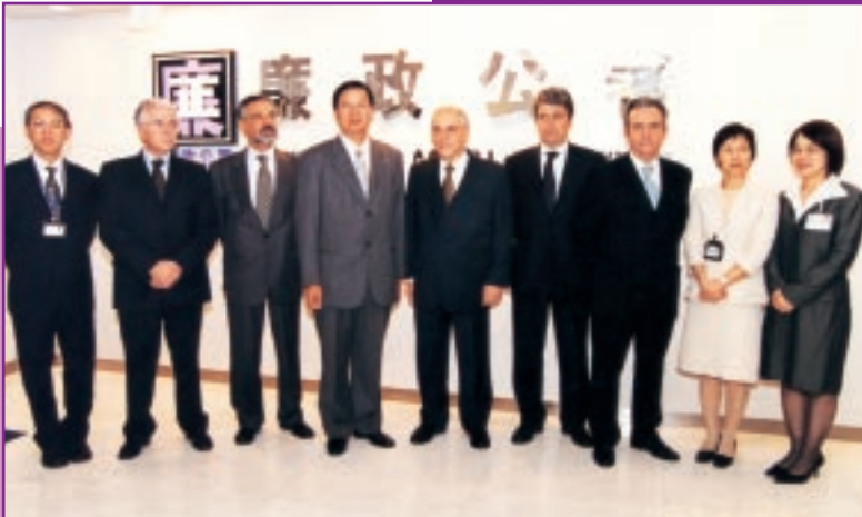
薛克率代表團訪廉署後與廉署領導層留影

葡萄牙最高法院院長薛克率領代表團一行五人，於2002年11月13日到訪廉政公署，受到廉政專員張裕及領導層的歡迎。張裕向代表團介紹了廉署的架構、運作及資源，並表示自回歸以來，特區政府和市民對廉政建設工作給予了大力的支持。