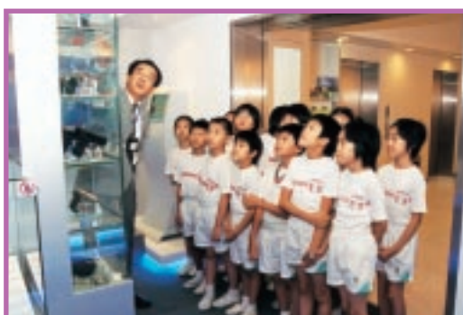
小學生前來廉署參觀展覽室