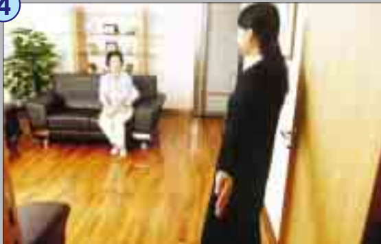
僅候片刻，調查員便引領她到舉報室。