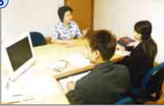
黎女士開始向調查員道出事實始末。