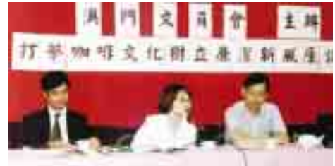
與澳門文員會舉辦『打擊咖啡文化，樹立廉潔新風』座談會