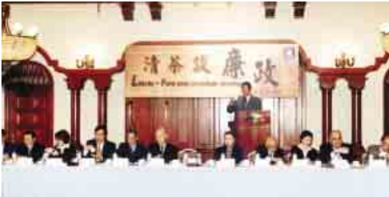
一年一度與傳媒工作者的聚會——『清茶談廉政』