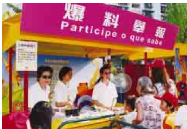
去年，「廉潔選舉義工隊」協助宣傳廉潔選舉信息。

藉著去年組織義工隊所取得的經驗，廉署月前開始重新招募義工，期望可以再次徵集一些有志為本澳社會推廣廉潔意識，創造廉潔空間，具服務熱忱，有責任感，不求回報的社會人士，成立「廉潔義工隊」，協助廉政公署開展肅貪倡廉的各項宣傳活動，推廣廉潔意識。