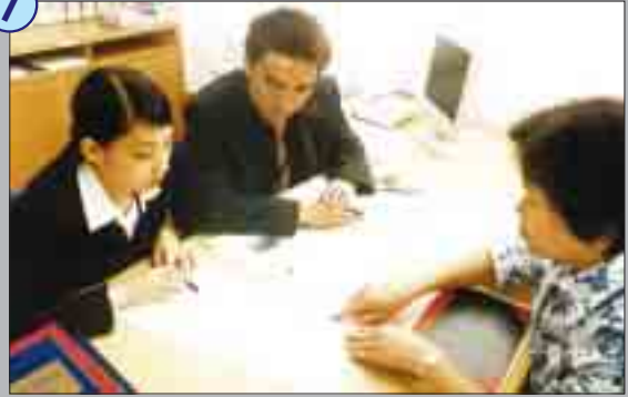
她還將若干證據呈交，並加以解釋。