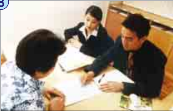
調查員向黎女士闡述舉報者應留意的事項，並告知在舉報後同樣負有保密的義務，不應隨意向他人透露已到廉署舉報，以免影響日後的調查工作。