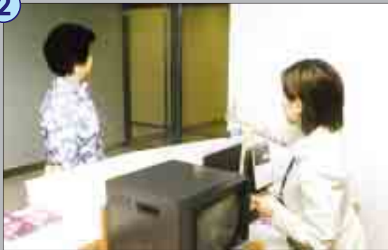
黎女士來到十四樓的接待處，職員交給她一個訪客證後便請她到下一層。