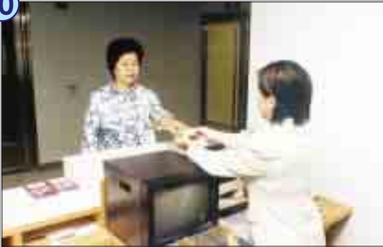
舉報完成，黎女士重上十四樓將訪客證交還便離去。