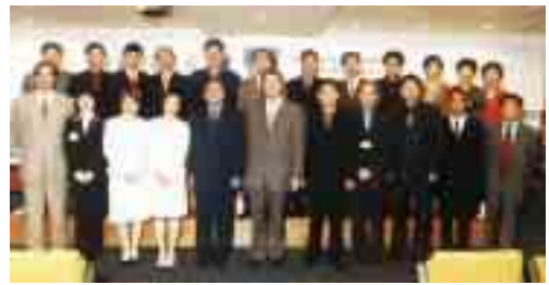
雲南省檢察院考察團來訪