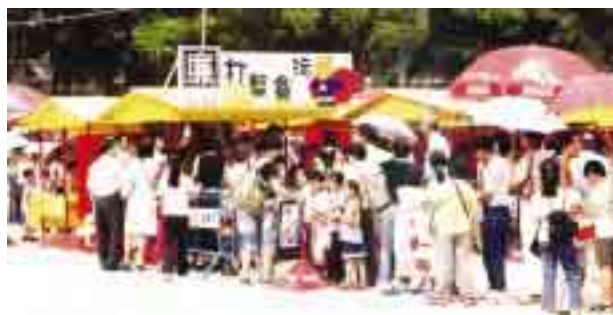
慶祝“六·一”兒童節遊戲攤位