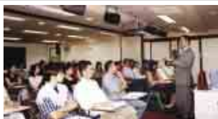
新一期『公務員廉潔奉公』講座展開，對象為行政人員及專業技術員。