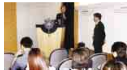
到海關作『如何加強在採購程序中的防貪意識』講座