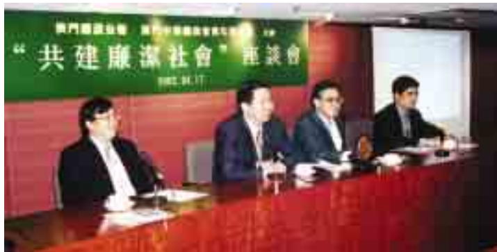
與中總青委合辦『共建廉潔社會』座談會