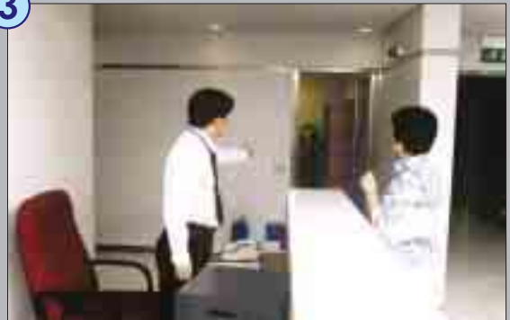
十三樓的職員請黎女士先入候客室稍候。