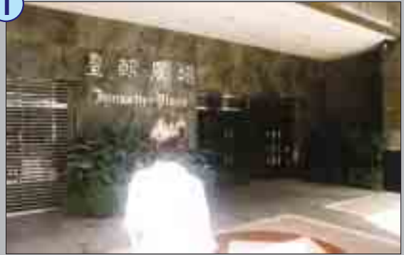
黎女士發覺有人收受非法利益，她決定做個好市民：向廉署舉報。這天，她來到了新口岸皇朝廣場，澳門廉政公署所在的地點。