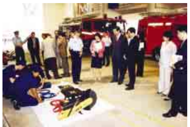
訪問消防局及參觀其設施和設備