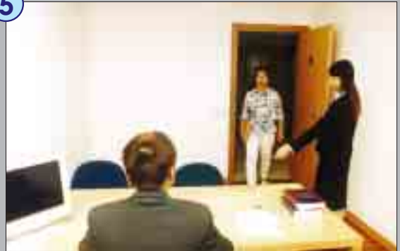
舉報室是一間絕對隔音的房間。