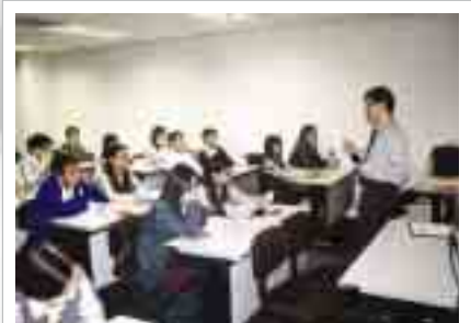
為大豐銀行職員作『肅貪倡廉』講座