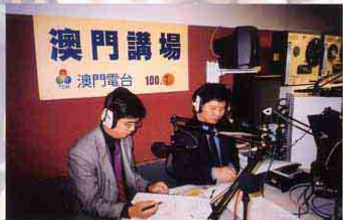
到電台宣傳反賄選