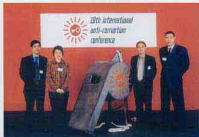
廉政公署代表團赴捷克首都布拉格出席第十屆國際反貪會議(10/2001)