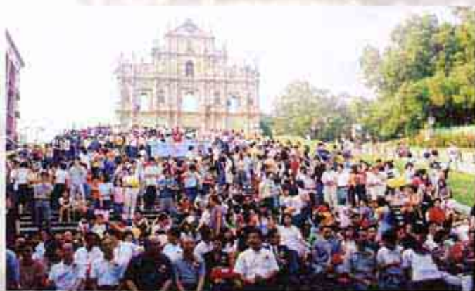
現場觀眾反應熱烈