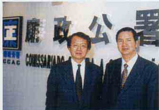
香港廉政專員黎年率團訪問廉署(02/2002)