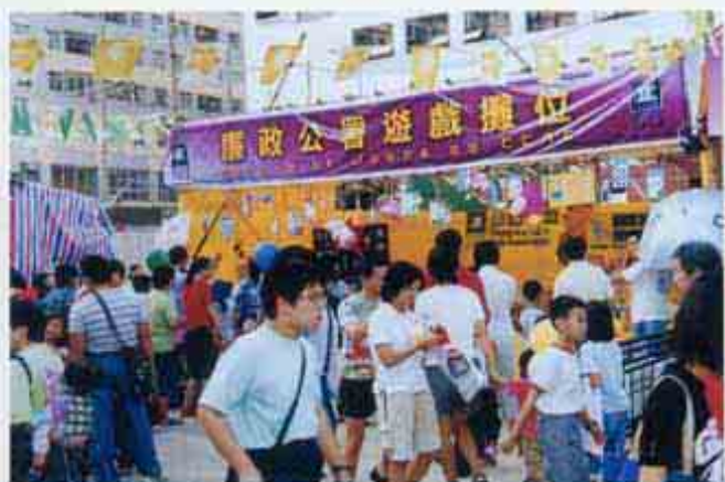
參與第32屆明愛慈善園遊會(11/2001)