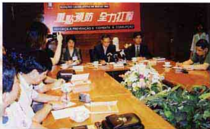
公佈反賄選策略記者會