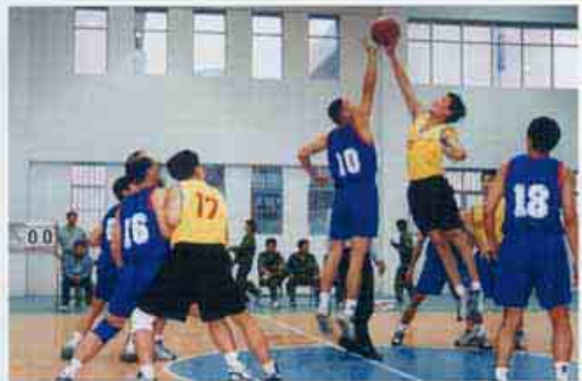
與珠海市人民檢察院進行體育交流(12/2001)