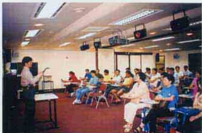
公務人員基本培訓課程之“廉潔精神”講座