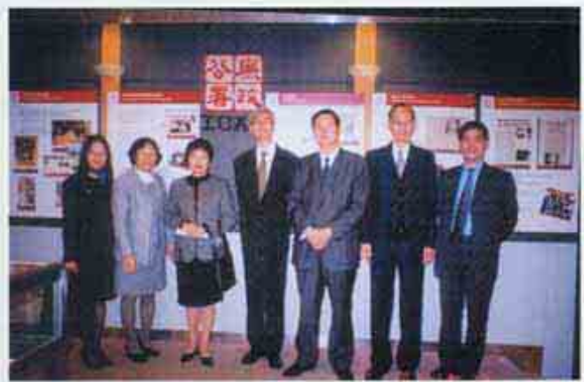
紀監會訪問香港廉署(12/2001)