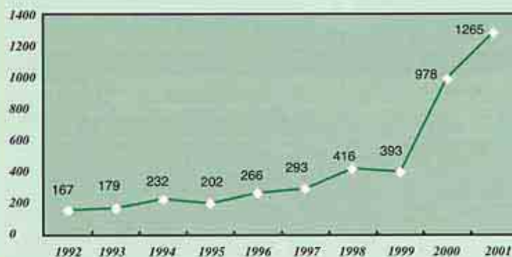
1992年至2001年收案數字比較