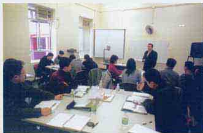
派遺調查人員赴香港廉政公署受訓