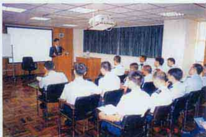
為治安警察局舉辦廉潔教育講座