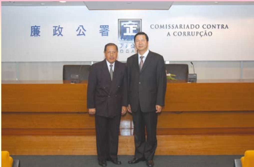
印尼申訴專員蘇查塔（Antonius Sujata）到訪廉政公署

為加強與本澳社團的聯繫，廉政公署領導層在2005年先後拜會了多個社團組織，並與社團負責人會晤，當中包括：澳門中華總商會、澳門街坊會聯合總會及其屬會、澳門工會聯合總會及其屬會、澳門婦女聯合會及其屬會、澳門建造業總工會、市販互助會、漁民互助會、離島婦女互助會、路環居民聯誼會、澳門文員會等。廉署藉着這些會晤機會，收集各方面對廉政工作的意見。