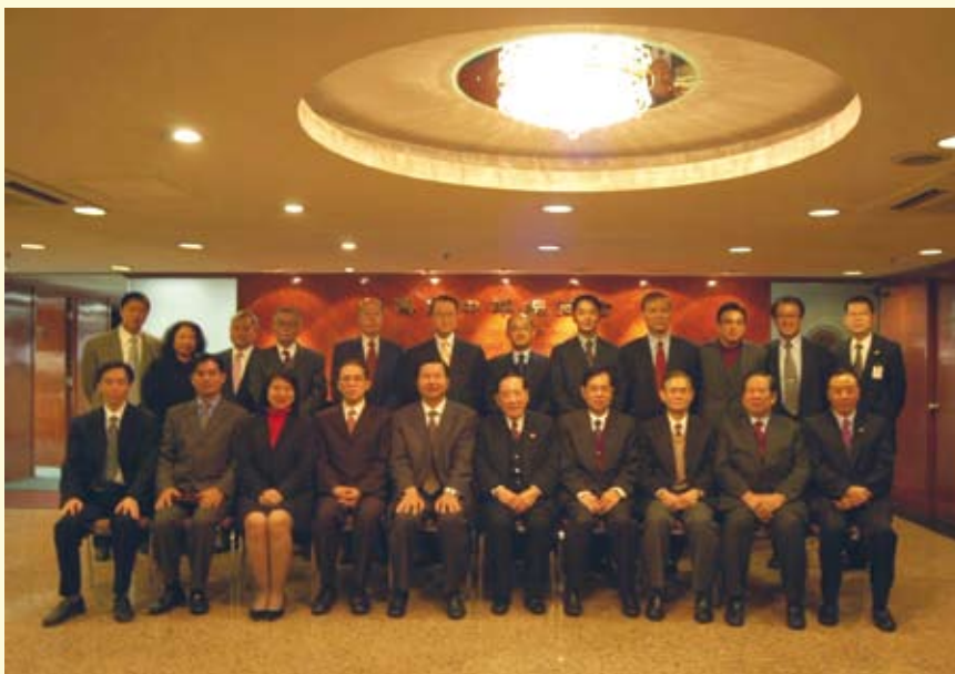
廉政專員訪中華總商會，與該會領導層合照

為加強與本澳社團的聯繫，廉政公署領導層在2005年先後拜會了多個社團組織，並與社團負責人會晤，當中包括：澳門中華總商會、澳門街坊會聯合總會及其屬會、澳門工會聯合總會及其屬會、澳門婦女聯合會及其屬會、澳門建造業總工會、市販互助會、漁民互助會、離島婦女互助會、路環居民聯誼會、澳門文員會等。廉署藉着這些會晤機會，收集各方面對廉政工作的意見。