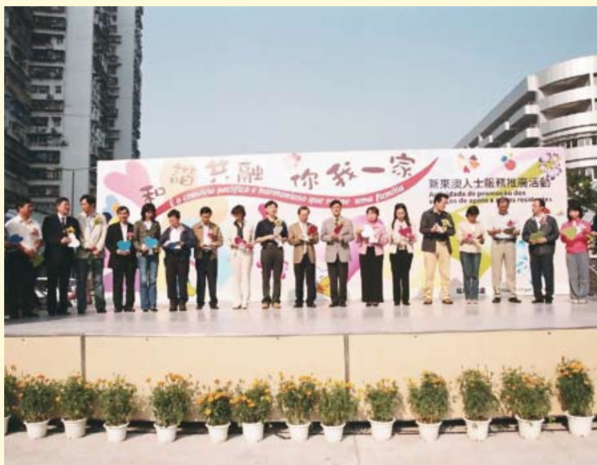
參與社會工作局主辦之“新來澳人士服務推廣”活動

- 參加多個公務員團體主辦的“公僕與你同歡慶”活動、工聯主辦的慶祝“六一國際兒童節”活動、少年警訊主辦的“滅罪禁毒嘉年華”活動、社會工作局主辦的“新來澳人士服務推廣”活動；