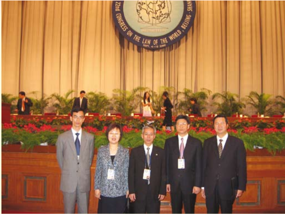
廉政專員出席於北京舉行的第22屆世界法律大會