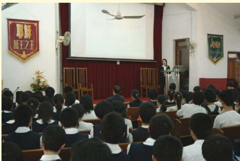
培正中學“廉潔周”啟動儀式

為了向中學生為深化“青少年誠信教育計劃”，廉署以數間學校為試點，向中學生推行“廉潔周”計劃，以多元化和互動的方式向中學生宣傳廉潔意識，培養青少年廉潔、正直的品德。