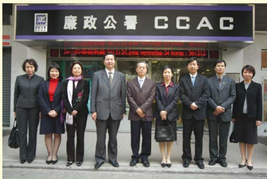
民政總署領導層參觀廉政公署社區辦事處