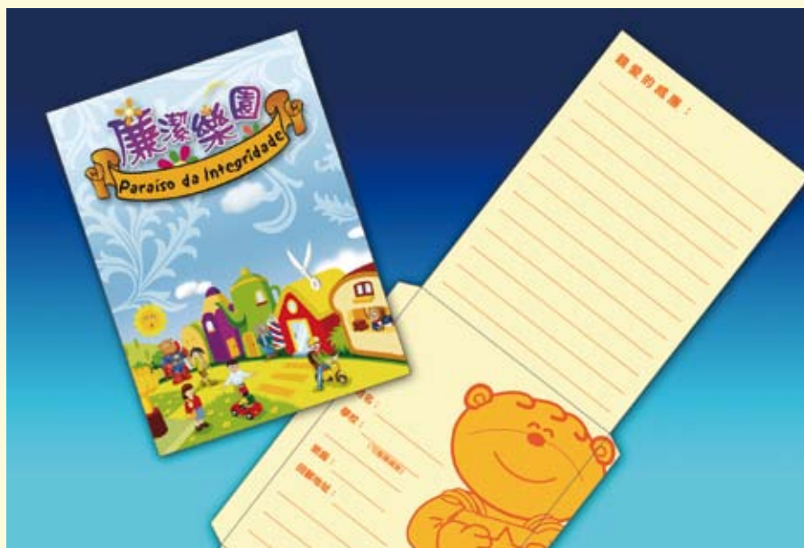
小學生可以用郵簡與廉政熊威廉通信

此外，廉政公署亦製作了一副名為“廉潔樂園”的遊戲棋，且備有中、葡、英三語，適合本澳不同學制的學校學生使用，寓教育於娛樂。