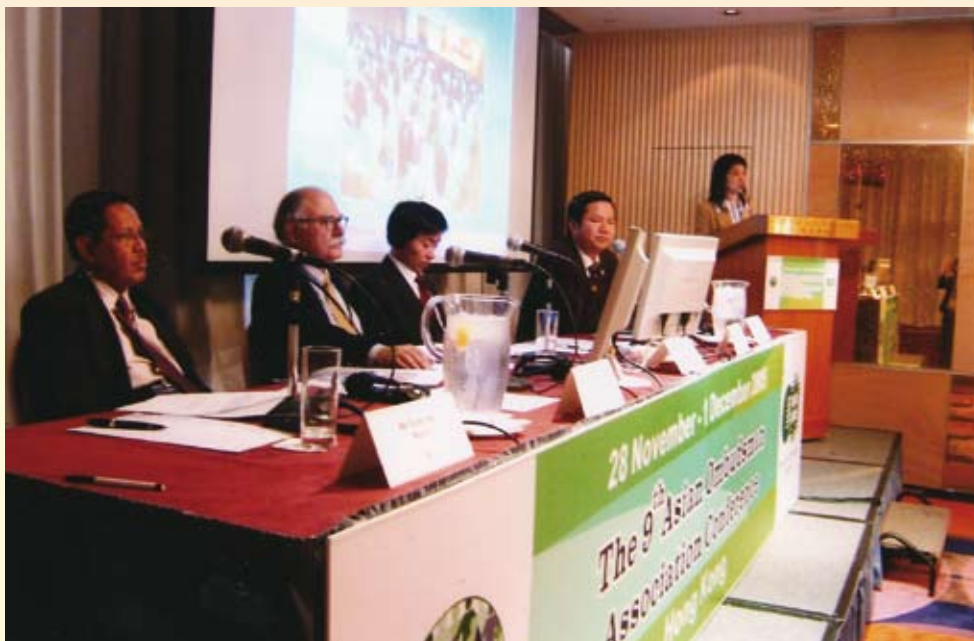
廉署參加亞洲申訴專員協會第九屆會議