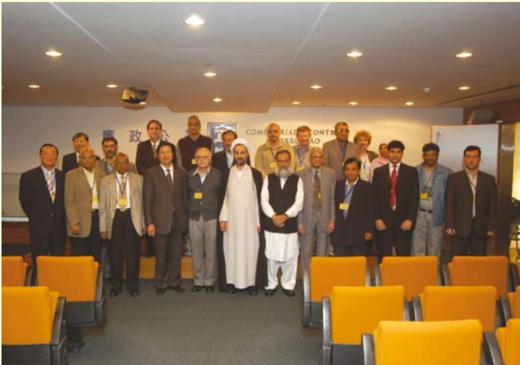
亞洲申訴專員協會成員訪廉署，與廉署領導層合照，前排左五為協會主席、巴基斯坦申訴專員薩希布扎德