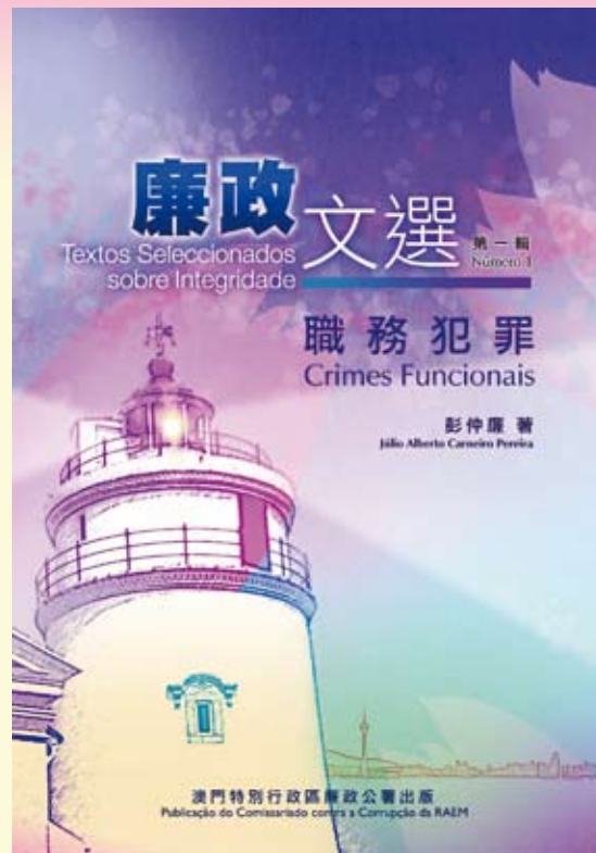
《廉政文選第一輯——職務犯罪》