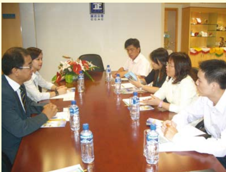
社團領導層參觀廉署社區辦事處，並與廉署代表座談

社區關係是廉政宣傳教育的重要資源。為了深化社區關係網絡，2005年廉署社區辦事處繼續探訪北區社團，聽取對澳門廉政工作、立法會選舉及社區辦事處運作的意見及建議，並爭取區內居民對廉政工作的信任和支持，鼓勵積極參與廉政建設。同時，廉署亦經常與多個北區社團合辦活動，傳遞廉潔守法的信息。