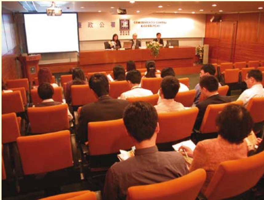
為中國工商銀行澳門分行人員舉辦“廉潔意識”講座

2005年，以機構人員和社團成員為對象的講座和參觀活動，總共舉行過12場，出席者合共510人次。