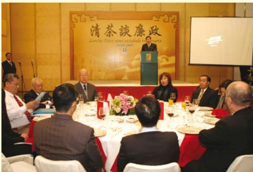
一年一度的“清茶談廉政”，廉署與傳媒機構領導聚首

與傳媒保持緊密的聯繫和維持良好的合作關係，是廉署一貫的工作方針，也有助於廉署和社會的溝通協作。