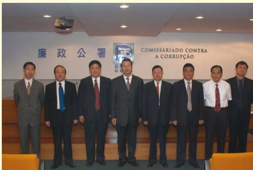
最高人民檢察院代表團來訪