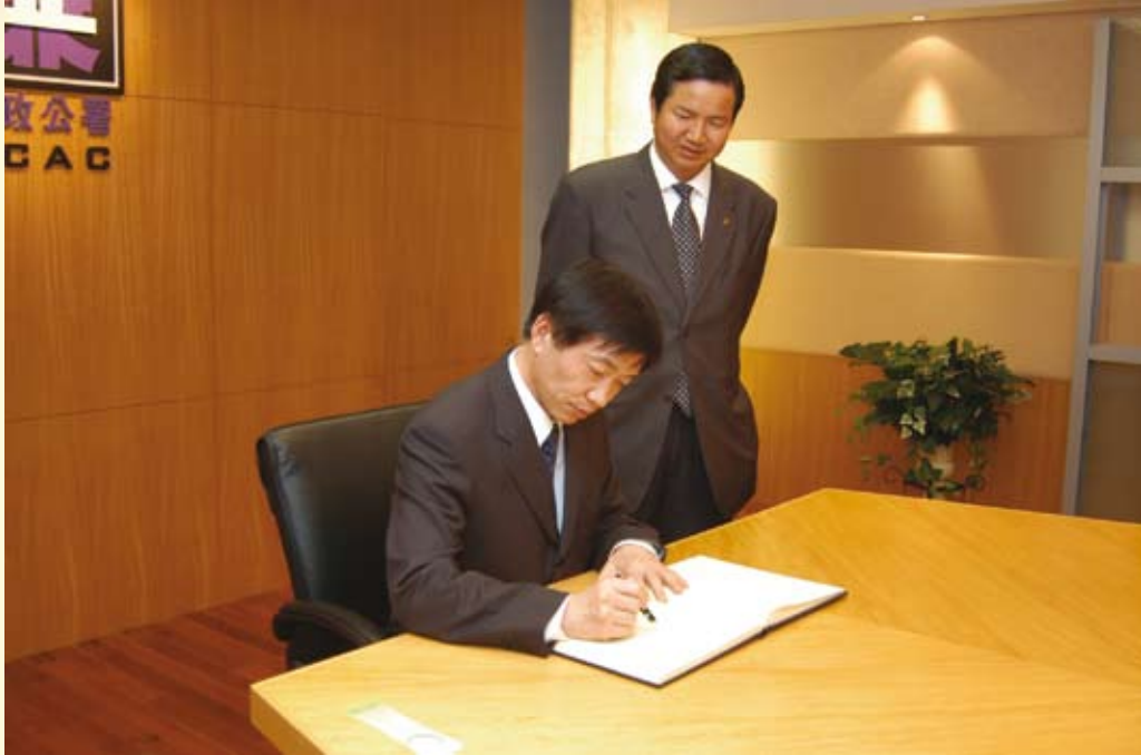
中國監察部副部長黃樹賢來訪，在廉署“嘉賓留名冊”上留言