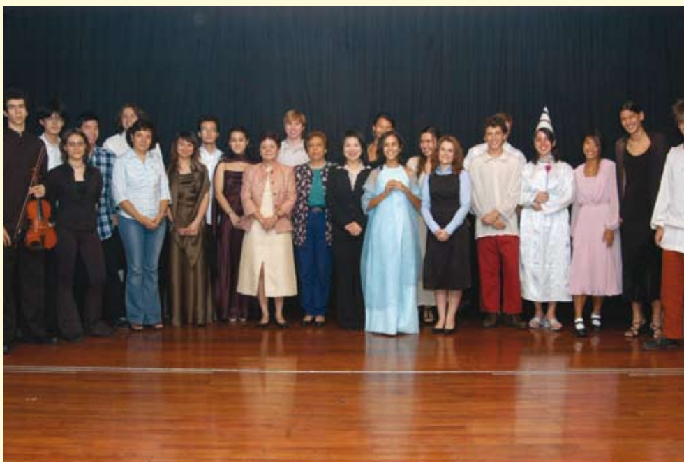
廉署代表與葡文學校領導及演出學生合照

周”所設計的活動儘可能與學校活動和常規德育課程相結合，並藉着經驗分享、影視素材、話劇和歌曲等多元化和互動的方式，向中學生傳遞正確的價值觀和廉潔守法的精神。活動項目包括在校園內展出有關廉署職能及處理個案實錄等內容的展板、紙上遊戲及由廉署派員向學生主講相關話題，並播放個案實錄短片。而學生也自行排演以真實故事改編的誠信短劇“成事不在天”，演唱“廉政之歌”等，其中葡文學校學生更自編、自導、自演以宣傳廉潔為主題的短劇“灰姑娘受賄”。