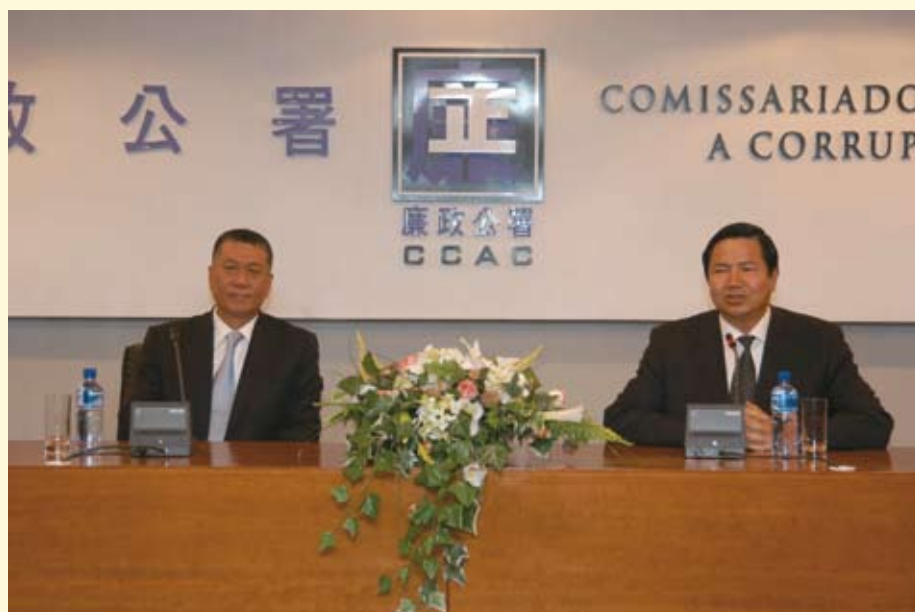
行政長官何厚鏞於2005年12月6日到訪廉政公署

中央駐澳單位、本澳多個公共部門、學術機構及社團的代表亦曾訪問廉署或參觀社區辦事處，包括：中國人民解放軍駐澳部隊代表、中央人民政府駐澳門聯絡辦公室代表、民政總署領導層、教育暨青年局領導層、公職人員協會代表、公務專業人員協會代表、澳門科技大學法律系學生等。此外，2005年底，行政長官蒞臨廉政公署，與廉署全體人員會面及發表講話，勉勵人員要繼續堅守崗位，為特區的健康發展作出更大的貢獻。