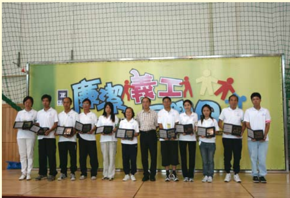
表現傑出的“廉潔義工隊”成員獲廉署表揚

2005年4月份，“廉潔義工隊”再次招募新成員，有逾200人獲接納，義工隊人數增至約380人，成員來自社會各階層，包括醫生、教師、工程師、公務員、學生、家庭主婦、退休人士等。7月中，廉署特為義工隊成員舉行同樂日，並向多年來積極參與活動的十多位義工頒發紀念品予以表揚。2005年，“廉潔義工隊”主要協助廉政公署宣揚廉潔意識。於9月份舉行的立法會選舉，義工隊參與了期間一連串的宣傳廉潔選舉活動。