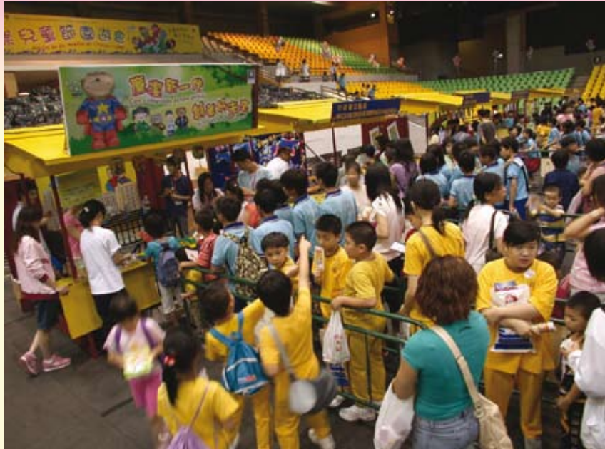
參與政府多個部門合辦的慶祝“六一兒童節”活動

- 參加多個公務員團體主辦的“公僕與你同歡慶”活動、工聯主辦的慶祝“六一國際兒童節”活動、少年警訊主辦的“滅罪禁毒嘉年華”活動、社會工作局主辦的“新來澳人士服務推廣”活動；