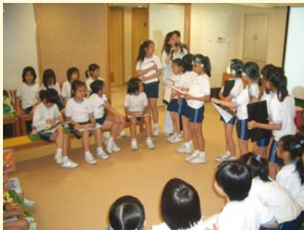
小學生在廉署社區辦事處參與“廉潔新一代”活動

2005年，廉署繼續向小四至小六年級學生推展“廉潔新一代 小學生誠信教育計劃”，以生動和靈活的多媒體方式（包括布偶劇、電腦動畫或電視短片），在社區辦事處的“廉潔樂園”活動教學室向小學生宣揚誠實和廉潔的信息。