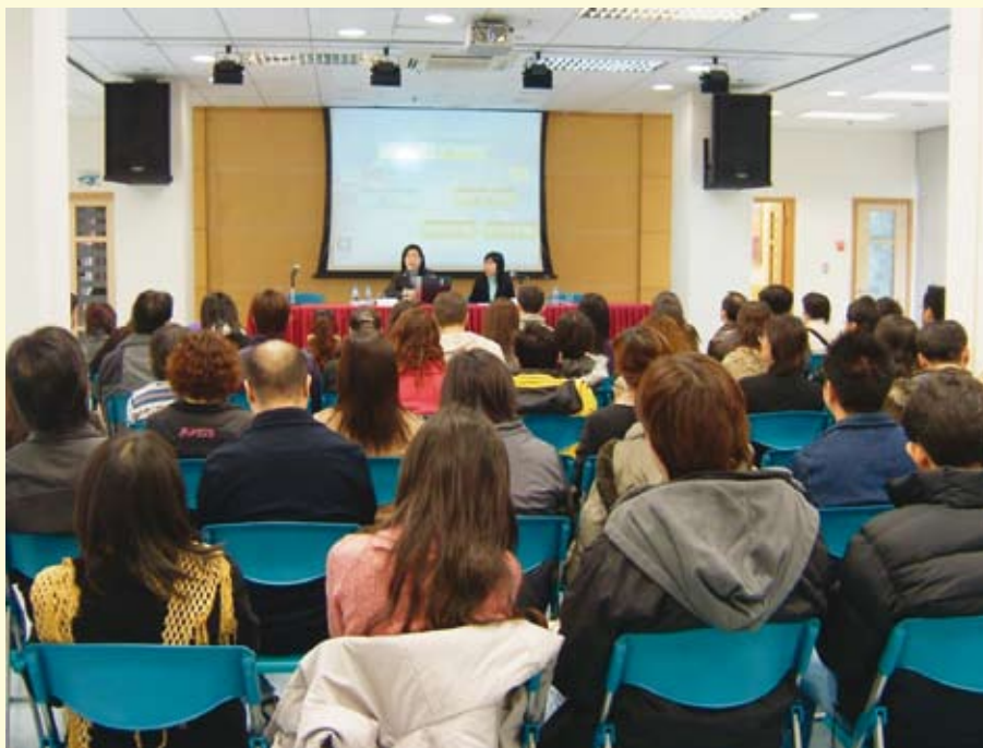
為部門公務人員舉行講座

自2001年7月起，廉署協助行政暨公職局在其舉辦的“公務人員基本培訓課程”中加入以“廉潔奉公”為題的講座。2005年相關講座共舉辦30場，包括粵語班18場、葡語班12場，參加者總數為880人。