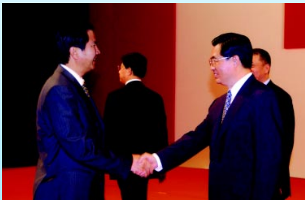
二零零四年十二月二十日慶祝澳門回歸祖國五周年大會暨 澳門特別行政區第二屆政府就職典禮