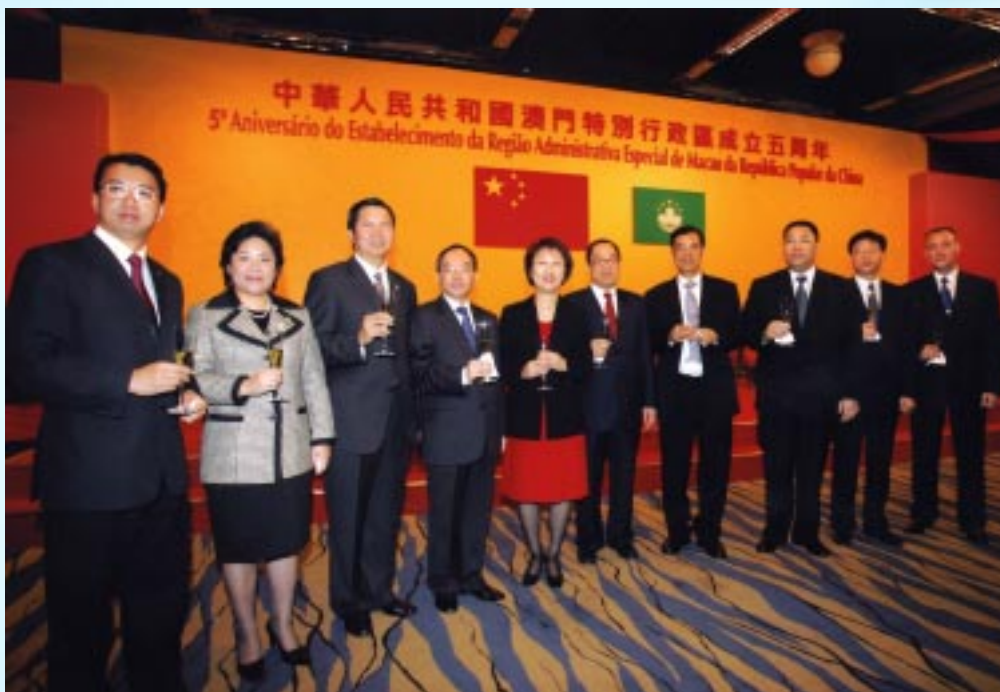
二零零四年十二月二十日慶祝澳門特別行政區成立五周年酒會