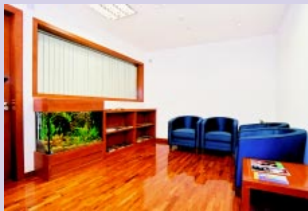
財產申報室一候客室