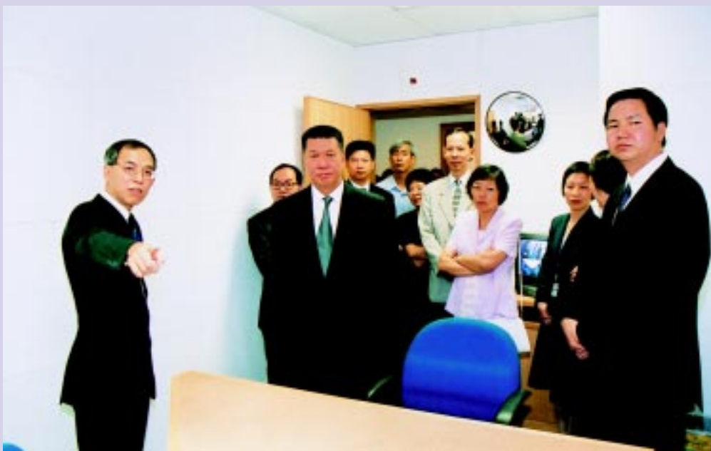
行政長官參觀新設施