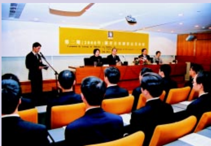
第二期調查員培訓班結業禮