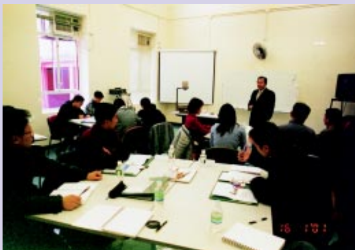
參加香港廉政公署培訓課程

除此以外，廉署還會安排調查人員前往外地與相關部門進行交流學習和實地參觀考察，參加國際性會議，吸取經驗。