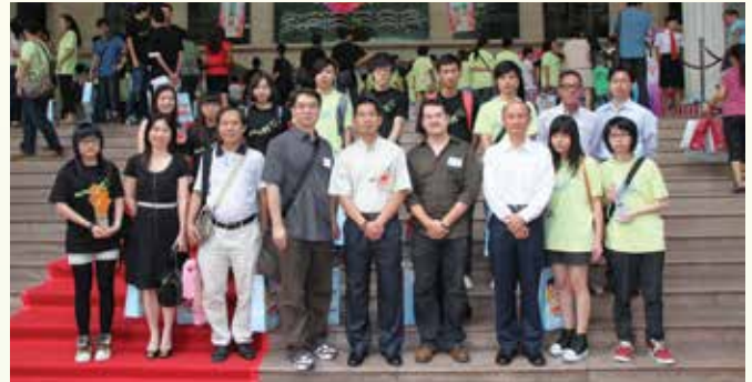
廉政專員馮文莊與評委曹長雄(左3)、黃天俊(右4)、澳門中聯辦監察室主任于柯超(右3)及得獎學生合照

由廣東省人民檢察院、澳門廉政公署和香港廉政公署合辦的「粵港澳青少年反腐倡廉電腦動畫/漫畫創作比賽」，2012年7月28日在廣東省檢察院禮堂舉行頒獎禮，廉政專員馮文莊率領代表團出席。廣東省人民檢察院檢察長鄭紅、澳門廉政專員馮文莊以及香港廉政專員白韞六主持了頒獎禮的開幕儀式。