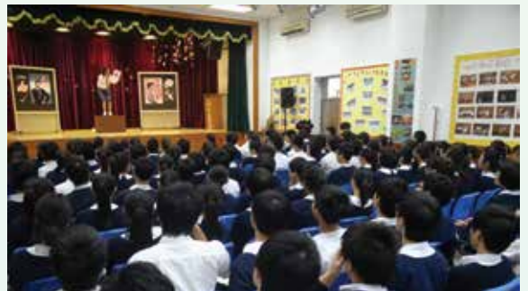
透過戲劇活動，提醒年青人勿因一時貪念而誤墮法網

針對今年立法會選舉新登記選民中有逾萬名24歲以下的年青人，廉署特別安排多項宣傳活動，包括講座、戲劇表演等方式，向青年人宣揚廉潔選舉的訊息，期望年輕一代在選舉活動中堅守廉潔誠信，自重自愛。