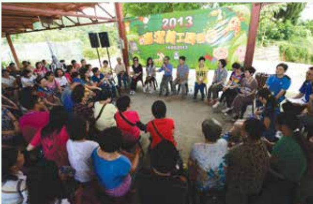
義工與廉署領導交流意見

除了組織義工隊協助倡廉宣傳工作外，廉署也鼓勵義工們多關心社會事務，加深對澳門各方面情況的認識和了解，提高公民意識。在廉署的組織下，「廉潔義工隊」先後參觀了澳門監獄、少年感化院、終審法院、香港廉政公署等，也曾參加公益金百萬行、植樹等活動。透過參與相關活動，義工們既豐富了自身的見聞，也對廉政建設工作有了更深入的理解。