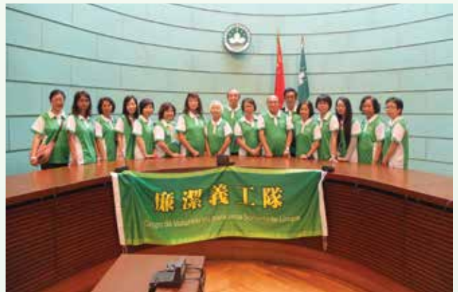
參觀澳門終審法院