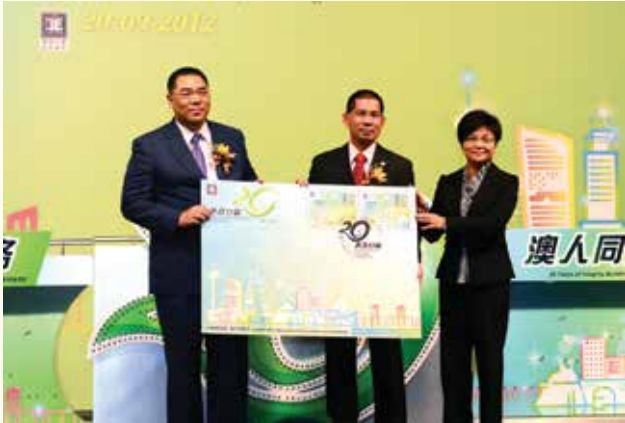
開幕式上，行政長官崔世安、廉政專員馮文莊及郵政局局長劉惠明主持了「廉政廿載」紀念郵品的發行儀式