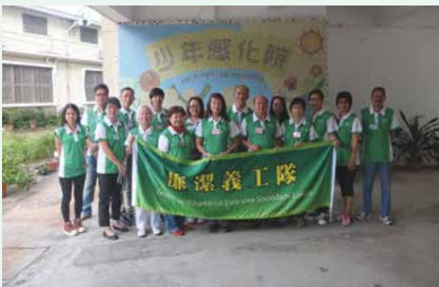
參觀澳門少年感化院