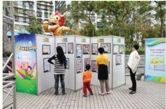
漫畫比賽優秀作品展