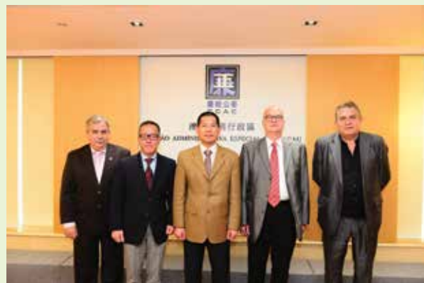
匈牙利基本權利專員Máté Szabó教授(右2)到廉署交流