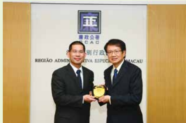
馮文莊專員向到訪的香港申訴專員黎年致送紀念品