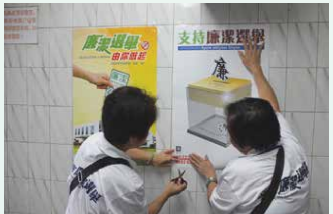
協助在屋苑張貼廉潔選舉海報