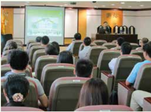
為南光天然氣有限公司舉辦私營領域防貪講座

除了拜訪地區社團外，廉署亦持續為不同團體和機構舉辦倡廉講座和座談會，以加強市民大眾對廉署反貪和行政申訴工作的認識，提高他們的守法及維權意識，同時發揮社會監督作用，勇於舉報貪污不法行為，從而達至社會對貪腐的零容忍。廉署歡迎各界預約舉辦各類防貪講座，合力推動建設廉潔社會。