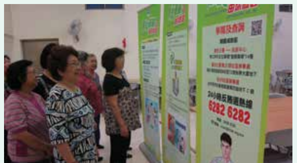
市民細閱社區巡迴展展板內容

自4月份起，廉署分別與本澳近50個社團合辦「廉潔選舉 由你做起」社區巡迴展覽，藉此向市民宣傳廉潔選舉的信息，提醒市民在立法會選舉期間的注意事項。此外，又在本澳多間中學舉行廉潔選舉學校巡迴展，讓學生們從中了解廉潔選舉的重要性。