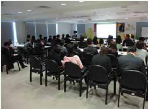
為澳門國際機場專營股份有限公司舉辦公務採購講座

除了拜訪地區社團外，廉署亦持續為不同團體和機構舉辦倡廉講座和座談會，以加強市民大眾對廉署反貪和行政申訴工作的認識，提高他們的守法及維權意識，同時發揮社會監督作用，勇於舉報貪污不法行為，從而達至社會對貪腐的零容忍。廉署歡迎各界預約舉辦各類防貪講座，合力推動建設廉潔社會。