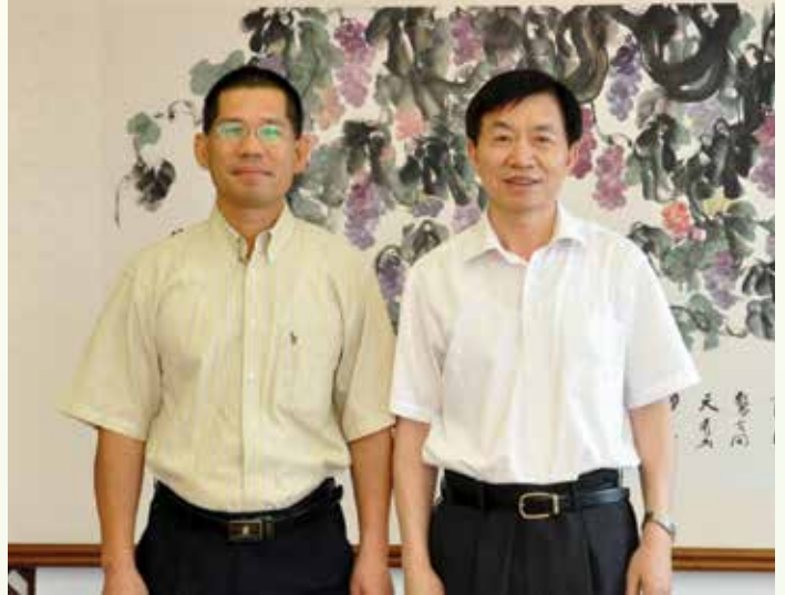
馮文莊專員與中共紀委副書記、監察部部長兼國家預防腐敗局局長黃樹賢合照

此外，馮專員向黃部長簡介了廉署對外合作和交流活動的情況，當中包括廉署派出代表以專家身分積極配合和參與中國（包括澳門及香港特區）於2014年接受聯合國專家審議其履行《聯合國反腐敗公約》的情況的工作；馮專員也感謝了監察部對廉署重返亞洲申訴專員協會理事會一事給予的支持。