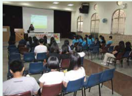
為鮑思高青年服務網絡學生舉辦廉潔選舉講座