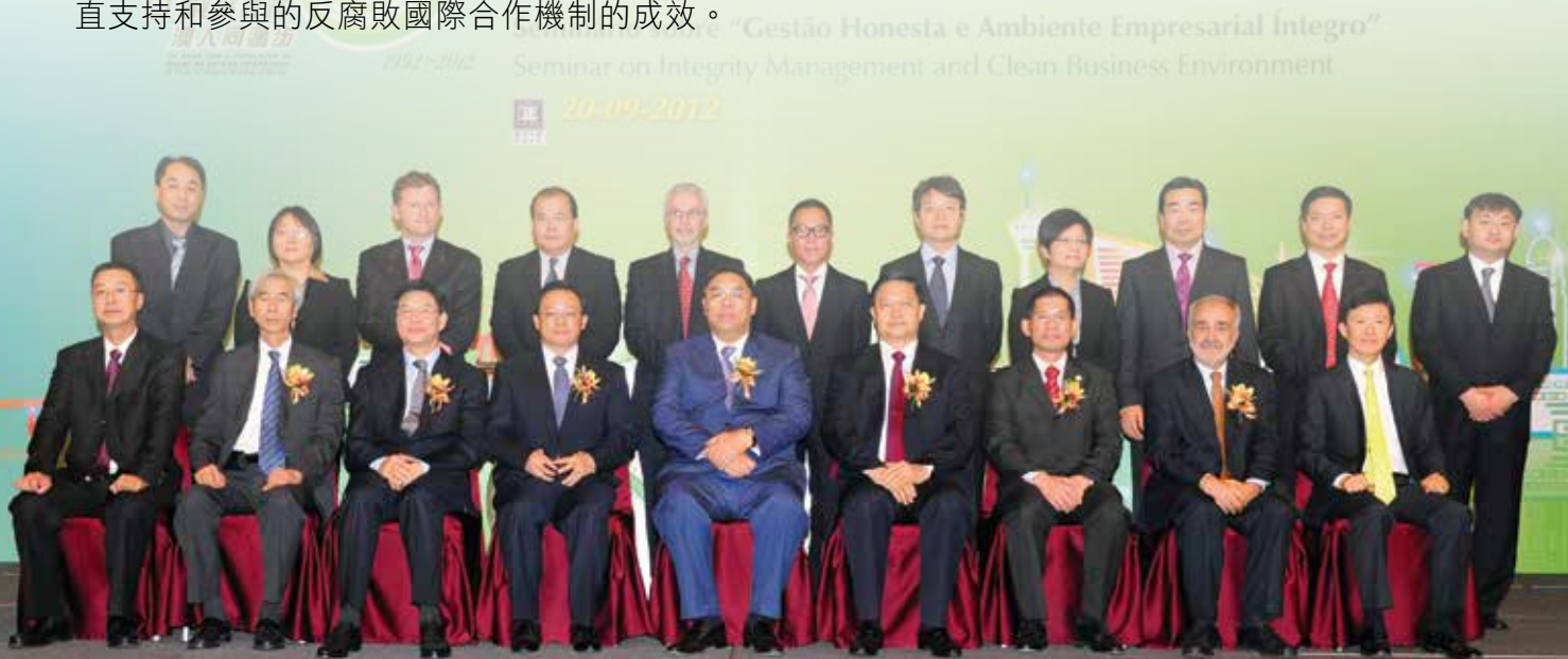
行政長官崔世安、廉政公署領導與嘉賓合照

行政長官崔世安在開幕式發表講話，他指出，誠信是構建文明法治、廉潔和諧社會的重要保障。是次研討會的舉行，充分說明了國際社會對反貪領域的交流合作的高度重視，也展示出澳門一直支持和參與的反腐敗國際合作機制的成效。