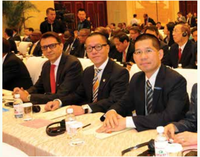
代表團成員攝於會場內

是次會議各與會代表均認同應加強資訊交流、進一步分享反腐敗經驗，切實履行《聯合國反腐敗公約》關於技術援助方面的條款，尤其向發展中國家盡力提供技術援助，包括財政捐助、物質支援和技能培訓等，以加強這些國家在反腐立法、機制建設、懲治和預防腐敗犯罪的能力。