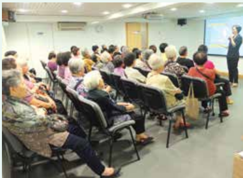
為南區四坊會頤康中心舉辦廉潔意識講座