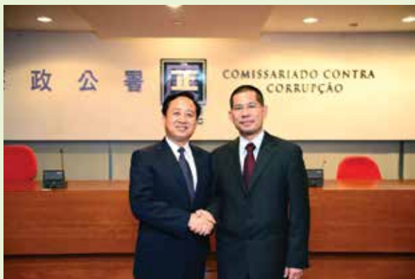
廣東省委常委、省紀委書記黃先耀率團訪問廉署，與馮文莊專員合照