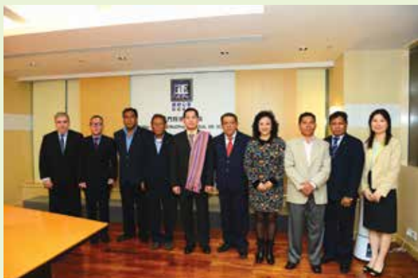
東帝汶共和國政府衛生監督代表團訪問廉署