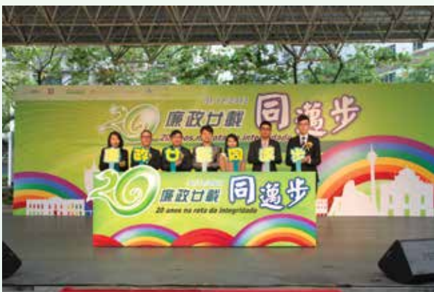
廉署領導與合辦單位代表主持開幕儀式

廉政公署與澳門青年聯合會、澳門工會聯合總會青年委員會、澳門中華新青年協會、澳門中華學生聯合總會及澳門街坊會聯合總會青年事務委員會5個青少年團體，於2012年12月1日假祐漢街市公園合辦「廉政廿載同邁步」綜藝活動，以輕鬆、互動的方法，透過表演節目、攤位遊戲、展覽等，向市民大眾宣揚廉潔意識，活動吸引了大批市民參加。