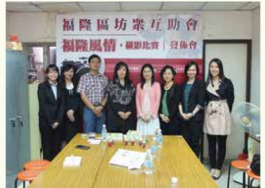
訪福隆區坊眾互助會

各受訪社團均對廉署近年開展的工作表示肯定和支持，認同倡廉教育推廣工作的重要性，希望廉署能加大執法力度，同時透過更多元化的渠道擴闊廉潔訊息的宣傳面及深化宣傳成效。此外，有社團表示廉署走訪各區與地方團體進行交流，有助提升市民對廉署職能的認識及了解，建議廉署持續與社會各界聯繫。