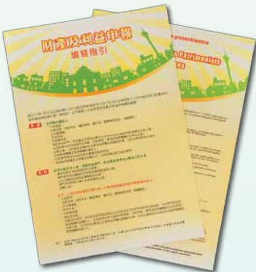
全新的財產及利益申報填寫指引

法律生效後，有義務提交財產及利益申報書的人士須使用及填寫新式樣的表格。為使申報者能掌握填報的內容及流程，廉政公署特別製作了全新的財產及利益申報填寫指引，並附有填寫示範，有關指引、示範以及申報表格電子版均可於廉署網站( www.ccac.org.mo )下載。