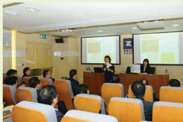
廣東省監察廳組織省內各市監察局及預防腐敗局局長到廉署研習澳門財產及利益申報制度