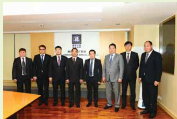
蒙古司法部代表團來訪