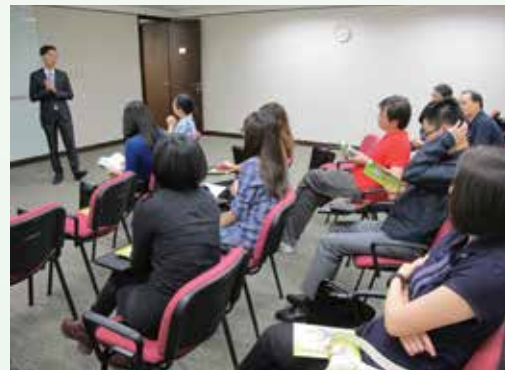
為中國人壽保險有限公司舉辦私營領域防貪講座