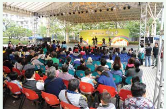
市民積極參與活動