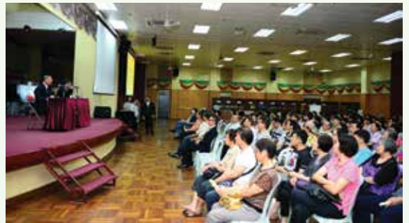
與社團合辦「廉潔選舉」講座

廉署為多個社團舉辦廉潔選舉講座，內容圍繞選舉精神、選舉法、選舉中容易出現的違規情況等問題，並即場解答市民的問題，冀讓市民大眾知法守法，自覺、自律地以實際行動支持廉潔選舉。