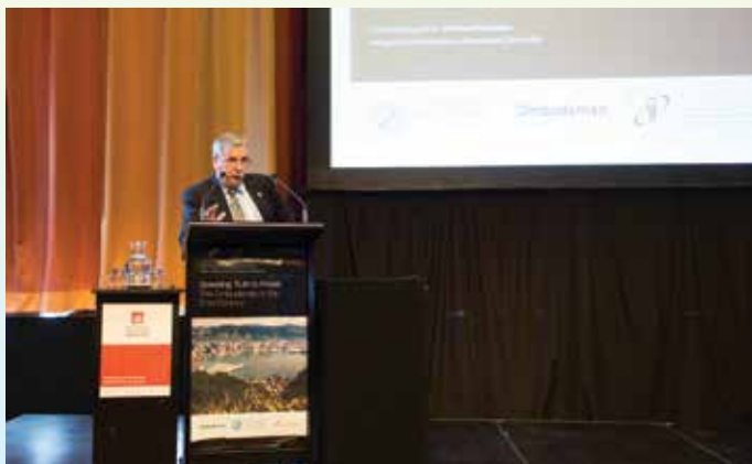
廉署法律專家Luís Rólo發表演說

第10屆IOI大會由新西蘭申訴專員公署承辦，以「說出真理 達至力量——廿一世紀的申訴專員」為主題，探討在政治、社會、經濟及科技發展下，申訴專員如何與時俱進，調整工作方向去繼續確保程序公平和行政公義。來自80多個國家和地區的申訴機構的280多名代表，法律界人士及學者等參加了會議，就相關議題進行交流。