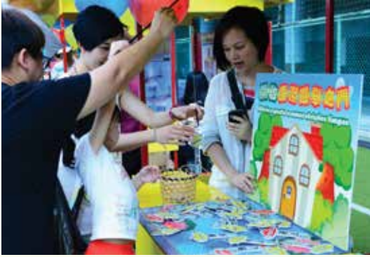
以攤位遊戲向市民傳遞反賄選訊息