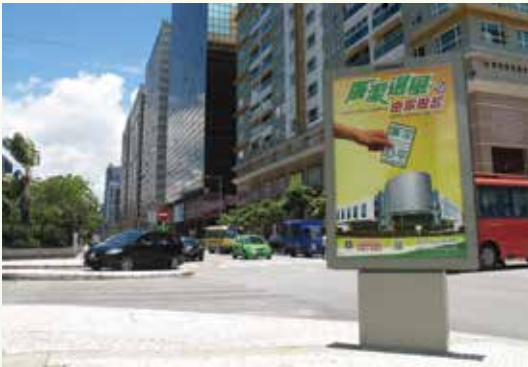
戶外宣傳廉潔選舉