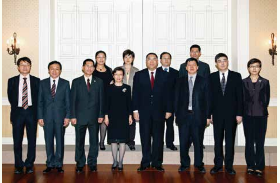
行政長官崔世安會見陳佩潔副司長（左4）率領的《聯合國反腐敗公約》履約審議事務協調組中央政府代表團

外交部條法司副司長陳佩潔率領《聯合國反腐敗公約》履約審議事務協調組中央政府代表團於2012年9月12日抵澳，與澳門特區「履約審議事務協調組」在廉政公署舉行工作會議，在澳期間，行政長官崔世安會見了代表團一行，就廉政建設、反腐敗工作及公約適用於澳門特區的跟進工作交換意見。