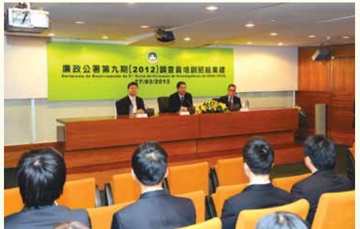
廉署領導主持培訓班結業禮

此外，廉政公署在今年6月公開招聘行政申訴調查員，以增聘各個專業領域尤其是法律方面的精英，加大力度開展行政申訴工作，確保公共部門依法行政，維護市民合法權益，目前，有關甄選工作正在進行中。