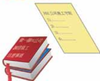
1 XXX 公司各級員工辦事規矩